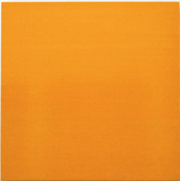
„History Painting. Yellow“ – 2016 Öl auf Leinwand / Oil paint on canvas 60 x 60 cm

Galerie Renate Bender Türkenstraße 11 D-80333 München Telefon: +49-89-307 28 107 Telefax: +49-89-307 28 109 galeriebender@gmx.de www.galerie-bender.de