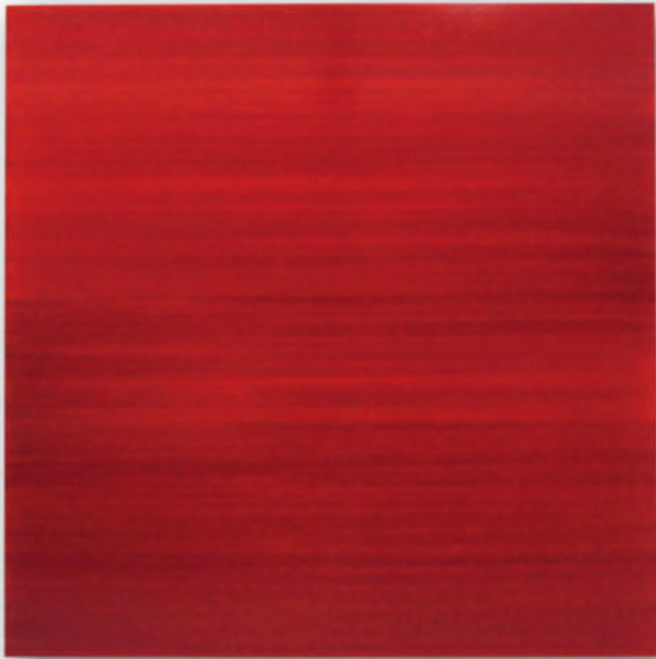
„History Painting. Red“ – 2016 Öl auf Leinwand / Oil paint on canvas 150 x 150 cm