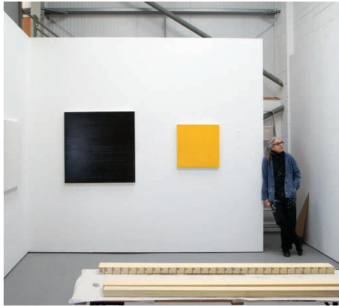
Atelieransicht / Studio view