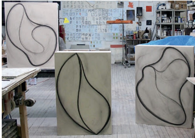
Zeichnung auf Polyurethan-Rohling Drawing on Polyurethane Block