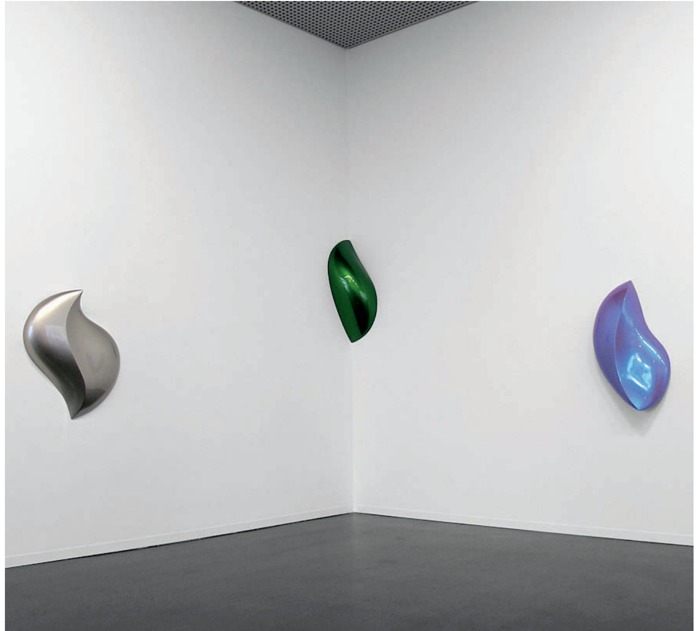
Ausstellungsansicht/Installation view „Embodying Colour“ – 2013, Kunsthaus Wiesbaden, Wiesbaden, DE Armet – 2012, 93 x 80 x 17 cm/36.5 x 31.5 x 6.75 inches (siehe Detail Titel/view detail on title) Crop – 2013 (siehe Außenseite/view Front page) Satori – 2013, 100 x 61 x 20 cm/39.5 x 24 x 8 inches Alle Arbeiten Urethan auf Polyurethan-Block/all pieces Urethane on Polyurethane Block

Massive urethane blocks are the starting point for Bill Thompson's wall objects. From this synthetic material he creates sculptural, self-referential forms. In the grinding process amorphous, often organically shaped objects emerge, which are then spray-coated with numerous layers of glossy automotive urethane. In his most recent work a sharp ridge through the middle of the object accentuates its softly curved front. For the first time the artist has also produced corner objects which open up new spatial locations for his work.