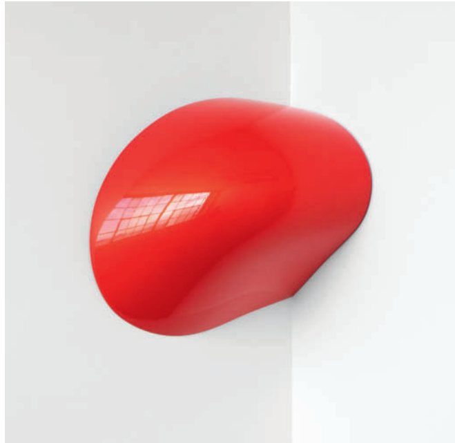
CO3 – 2013, Urethan auf Polyurethan-Block/Urethane on Polyurethane Block 47 x 47 x 27 cm/18.5 x 18.5 x 10.5 inches

Galerie Renate Bender Maximilianstraße 22/2.Stock D-80539 München Telefon: +49-89-307 28 107 Telefax: +49-89-307 28 109 E-Mail: galeriebender@gmx.de www.galerie-bender.de