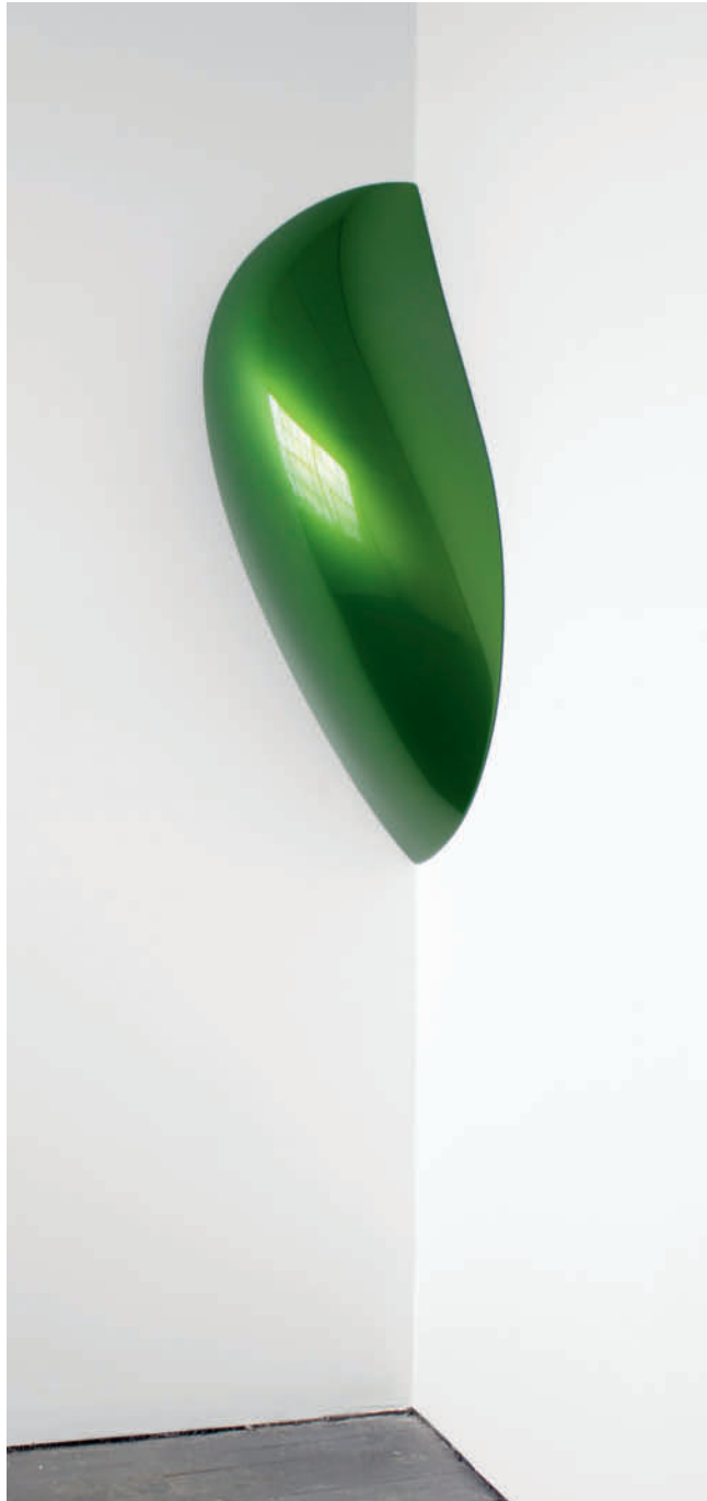
Crop – 2013, Urethan auf Polyurethan-Block/Urethane on Polyurethane Block 103 x 33,5 x 34 cm/40.75 x 13.15 x 13.4 inches