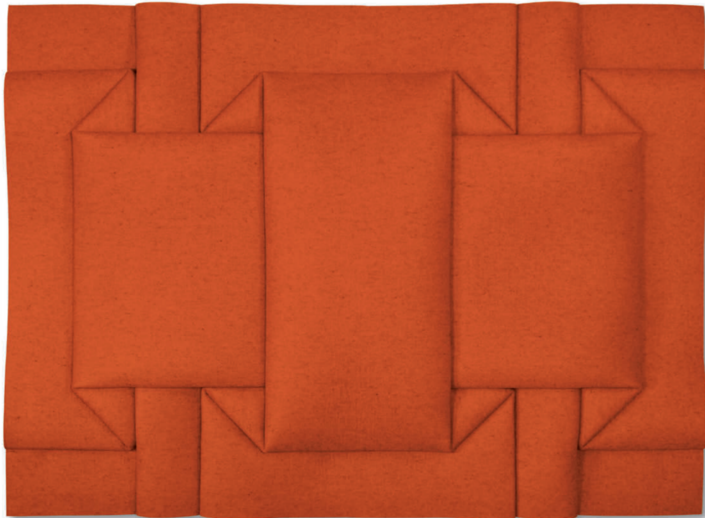
Flächendurchdringung FOR10 – 2021, Filz orange gefaltet / Orange felt folded, 125 x 170 cm Siehe Detail Titelseite / View detail on title

„Das Faltmaterial wandelt sich aus der Fläche zu einem architektonischen Gebilde, um dann wieder als Relief in die Fläche zu gleiten. Es ist der Gedanke der Ganzheit, der mich fasziniert und reizt, immer wieder an die Grenzen des Machbaren zu gehen, um komplizierte Sachverhalte der Gestaltung zu lösen.“