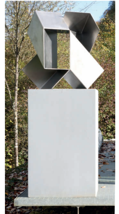
Twins I – 2017 Edelstahl gefaltet, Auflage 3 Ex. / Stainless steel folded, edition of 3, 62 x 59 x 37 cm

Galerie Renate Bender Türkenstraße 11 D-80333 München Telefon: +49-89-307 28 107 Telefax: +49-89-307 28 109 office@galerie-bender.de www.galerie-bender.de