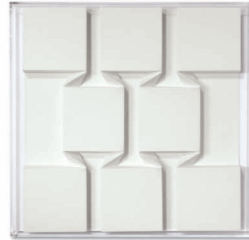
Faltzustand V – 2020 Arches Büttel gefaltet, Acrylglashaube / Arches hand made paper folded, acrylic glass cover, 51,5 x 53 cm