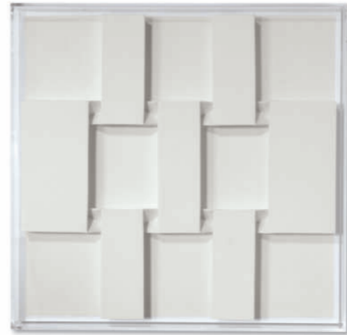
Faltzustand R – 2020 Arches Büttel gefaltet, Acrylglashaube / Arches hand made paper folded, acrylic glass cover, 51,5 x 53 cm

Please see our homepage for an updated information on opening hours and events.