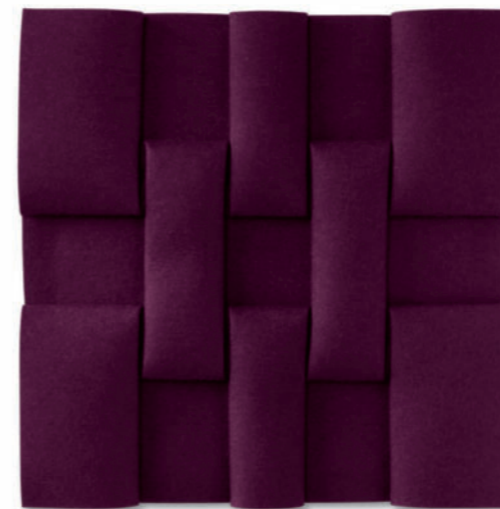
7 Quadrate (Rückseite) – 2019 Filz violett gefaltet / Violet felt folded, 54 x 54 cm