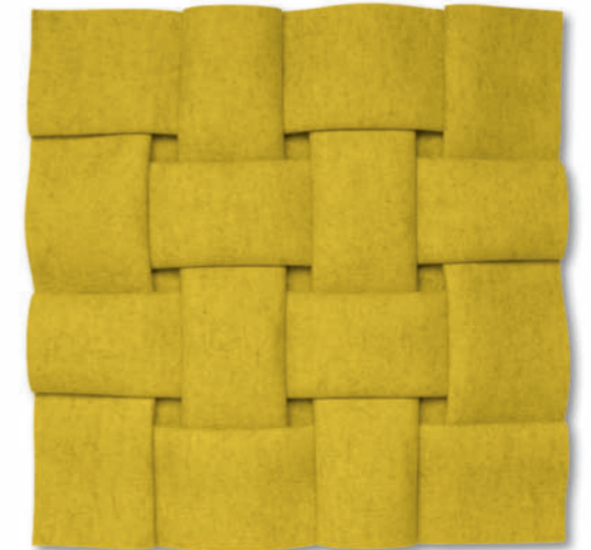
Vernetzung FG6 (rechts) – 2017 Filz gelb gefaltet / Yellow felt folded, 55 x 55 cm

Im Jahr 2019 erschien ein zweibändiges Werkverzeichnis der Arbeiten von Peter Weber aus den Jahren 1968-2018 im Hirmer-Verlag München.