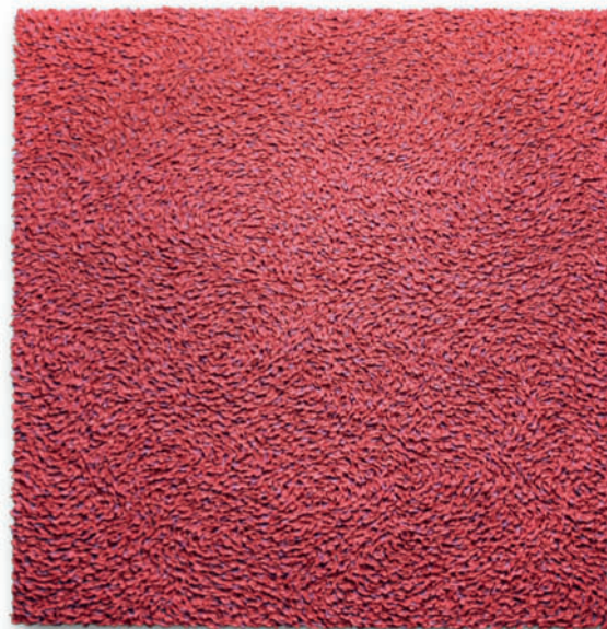
"25,908" – 2016, Öl auf Leinwand / Oil on canvas, 122 x 117 cm

Vernissage: Donnerstag, 12. Januar 2017, 19 bis 21 Uhr Matinee: Samstag, 14. Januar 2017, 11 bis 15 Uhr