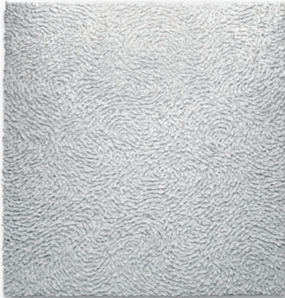
"18,424" – 2015, Öl auf Leinwand / Oil on canvas, 122 x 117 cm