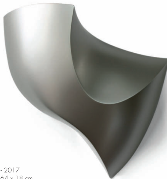
Brute - 2017 61 x 64 x 18 cm

Foto auf der Titelseite / Photo on front page: Cane - 2019 122 x 42 x 18 cm