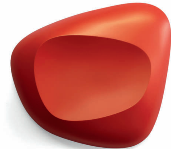
Scoop.red - 2018 79 x 89 x 13 cm

Vernissage: Donnerstag, 23. Januar 2020, 19 bis 21 Uhr Matinee: Samstag, 25. Januar 2020, 12 bis 16 Uhr