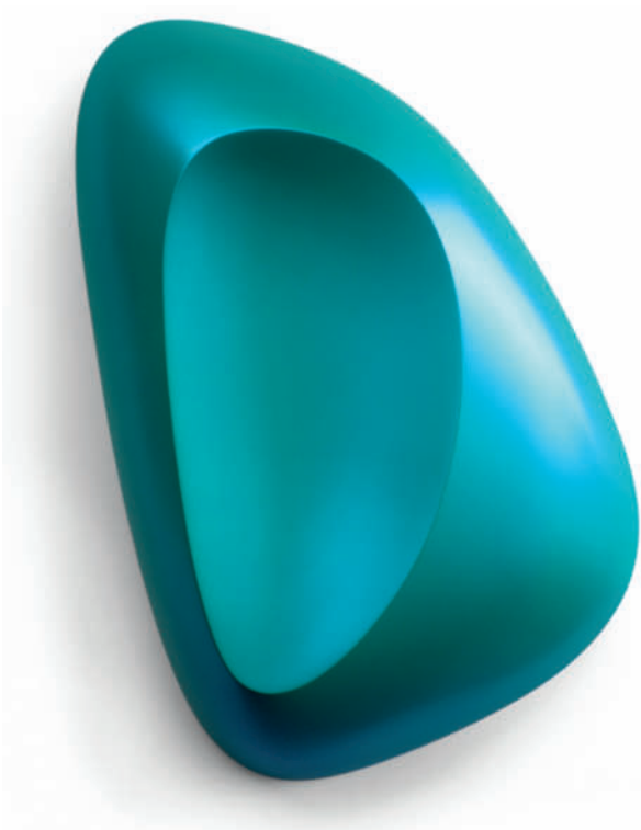
Scoop.turquoise - 2018 88 x 65 x 13 cm