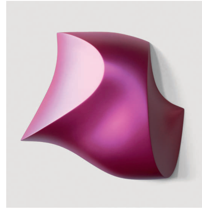
"Viola" – 2017 Urethan auf Polyurethanblock / Urethane on polyurethane block 57 x 65 x 17 cm