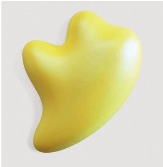
"Oblivia" – 2017 Urethan auf Polyurethanblock / Urethane on polyurethane block 93 x 77 x 17 cm