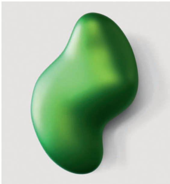
"Spawn" – 2010-16 Urethan auf Polyurethanblock / Urethane on polyurethane block 73 x 48 x 19 cm