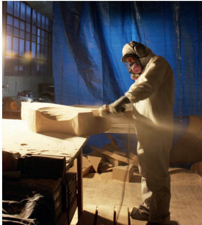
Studioansicht: Schleifen von "Corsair" / Studio view: carving "Corsair"

Galerie Renate Bender Türkenstraße 11 D-80333 München Telefon: +49-89-307 28 107 Telefax: +49-89-307 28 109 galeriebender@gmx.de www.galerie-bender.de