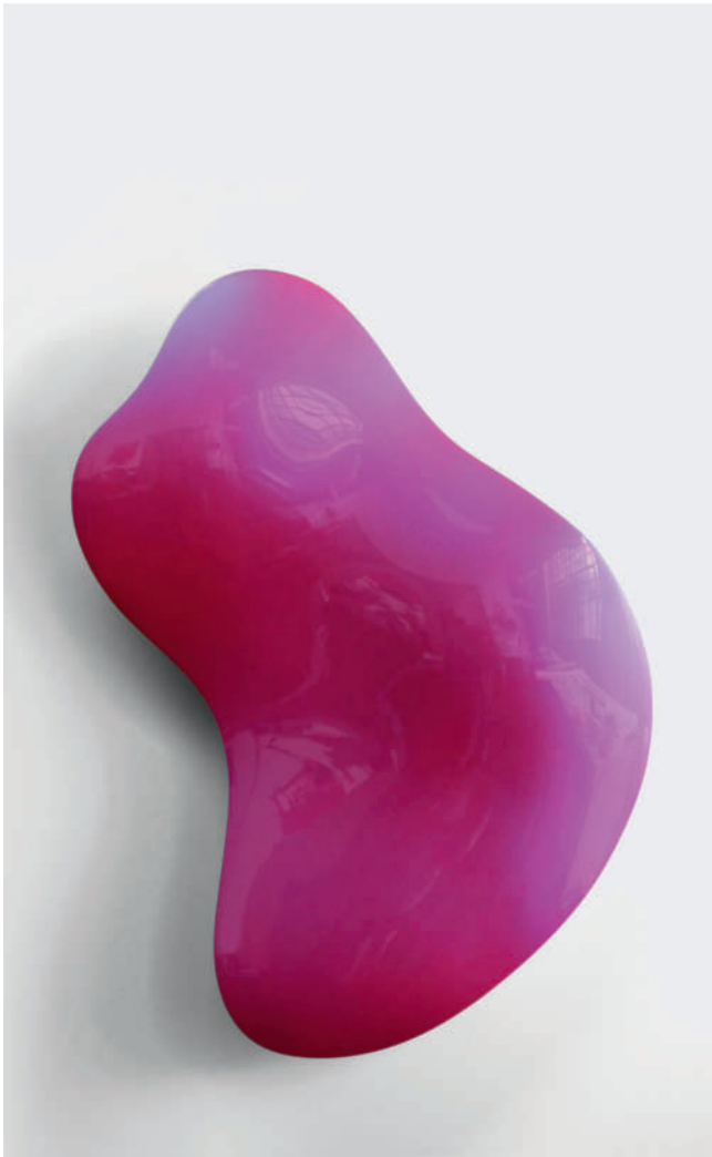
„Martin“ - 2011 - Urethan auf Polyurethan-Block - 102 x 76 x 15 cm “Martin” - 2011 - Urethane on Polyurethane Block - 40 x 30 x 6”