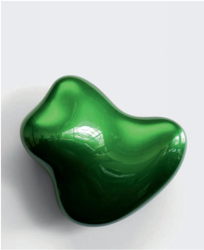
„Hunter“ - 2012 - Urethan auf Polyurethan-Block - 52 x 59 x 22 cm “Hunter” - 2012 - Urethane on Polyurethan Block - 20 x 23 x 9”