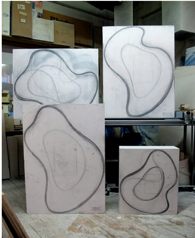
Zeichnung auf Polyurethan-Rohling Drawing on Polyurethane Block

Galerie Renate Bender Maximilianstrasse 22/II D-80539 München Telefon: +49-89-307 28 107 Telefax: +49-89-307 28 109 E-Mail: galeriebender@gmx.de www.galerie-bender.de