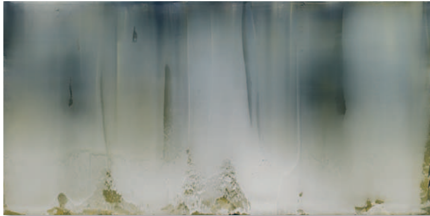
Payne's Gray, Naples Yellow, Titanium White Horizontal Painting # 1 – 2005 Pigment und Acryl auf eloxiertem Aluminium 100x200 cm