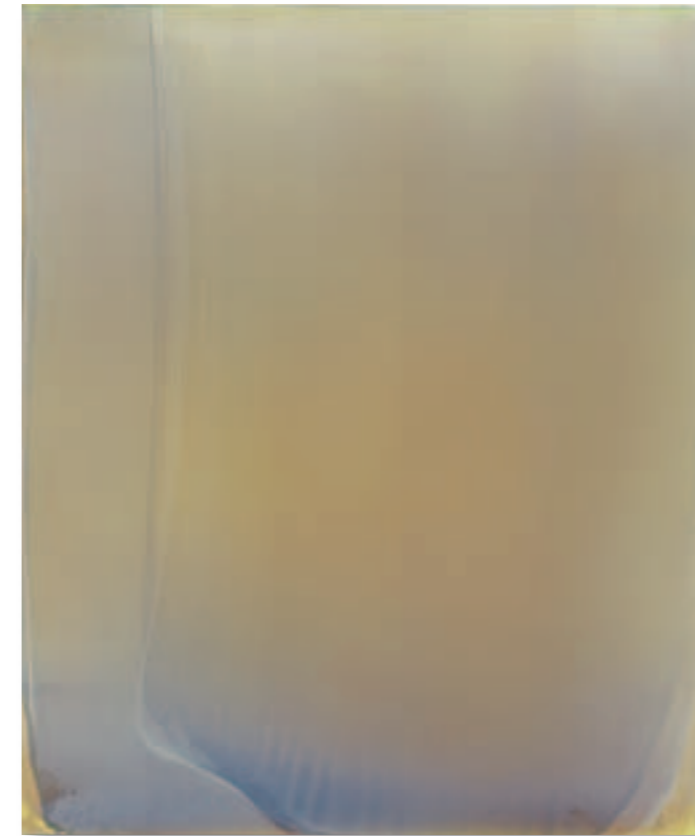
Burgundy Light – lapis lazuli over Yellow Painting – 2010 Pigment und Mischtechnik auf weißem Dibond 90x75 cm