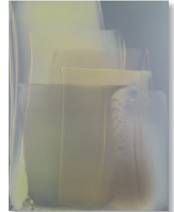
Composition of Violet Grays and Yellow – 2010 Pigment und Mischtechnik auf eloxiertem Aluminium 60x45 cm

Matt McClune will den Wettstreit mit der Natur nicht wirklich aufnehmen, sondern nur einen hohen Grad an Durchlichtung erreichen. Seine Bilder sollen mehr oder weniger materialisiertes farbiges Licht sein. Deshalb experimentiert er mit unterschiedlichen Farbtägern, um zu sehen, wie sich die Farbe durch das Trägermaterial verändert. Anfangs nahm er einfache Aluminiumplatten, heute ist es zumeist eloxiertes Aluminium, weil dieses das Licht diffus reflektiert. In Verbindung mit den Farbschichten entsteht so eine durchlichtete glänzend farbiges Oberfläche. Die Farben sind selten satt und opak, meist glasklar und transparent. In den zentralen Partien scheinen seine Bilder reine Lichtwesen ohne jede Materialität zu sein. An den Rändern löst der Künstler diese schwebende Immaterialität auf, indem er den Ansatz des Farbauftrags stehen lässt oder den Farbverlauf in jeder Schicht von Neuem so lenkt,