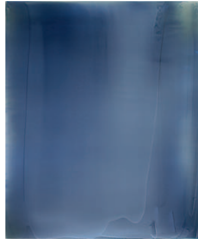
Blue Painting – 2010 Pigment und Mischtechnik auf weißem Dibond 90x75 cm