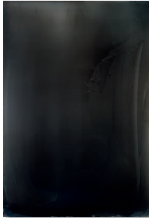
Azurite Blue with Manganese (Black) Painting – 2006/2010 Pigment und Mischtechnik auf eloxiertem Aluminium 90x62 cm