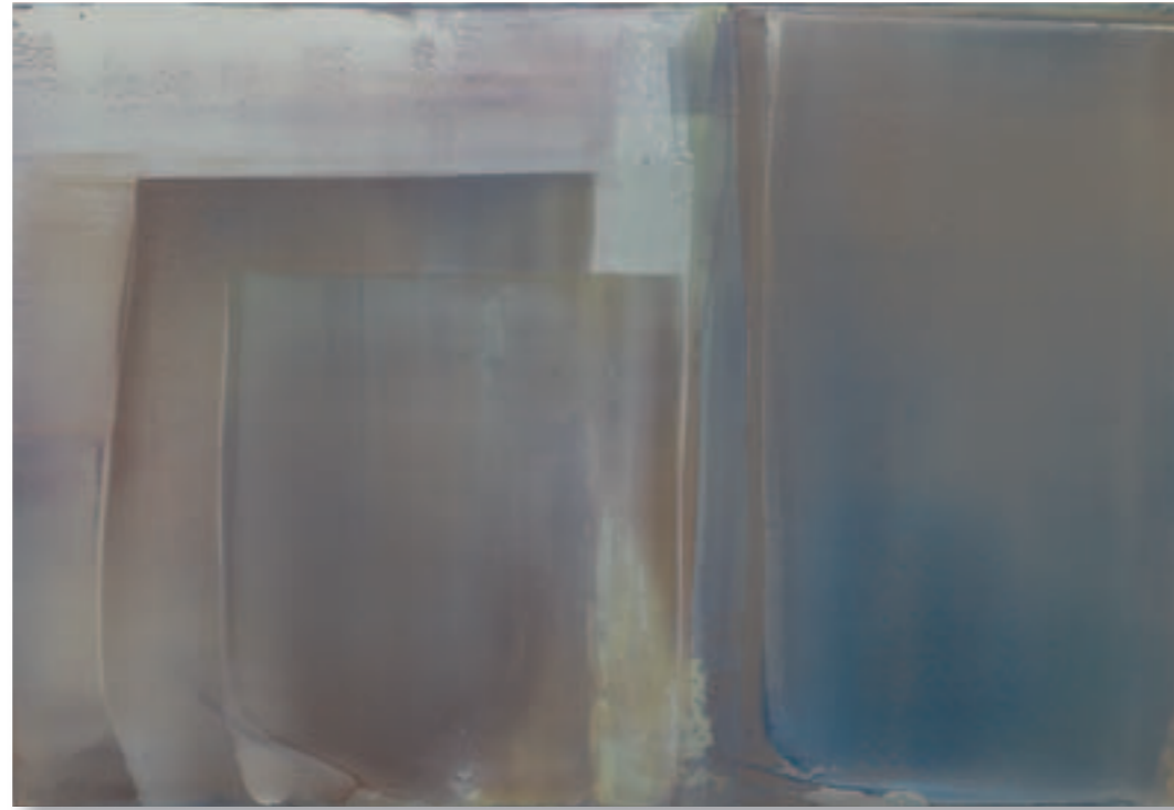
Autumn 2010/Winter 2011 Large Horizontal Composition (Burgundy Light) Pigment und Mischtechnik auf weißem Dibond 150x225 cm