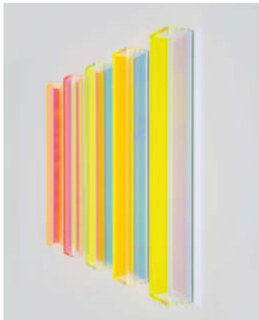
colormirror rainbow miami vertikal – 2017 5-tlg. / 5 pcs., Edition 1/2, je / each 60 x 8 x 6 cm Schwarz- und Tageslichtansicht / Photographed under black- and daylight