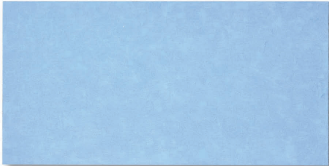
M007S azzurro 457141 – 2017 Pigment auf Sandstein / Pigments on sandstone 15 x 35,50 x 3 cm