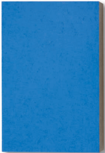
005p1 azzurro 45080+pp – 2018 Pigment auf Sandstein / Pigments on sandstone 21 x 14 x 3,3 cm