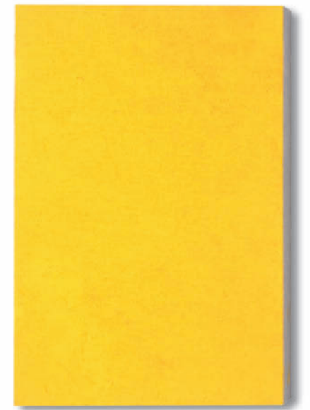
D08Σ giallo 23380 – 2019 Pigment auf Sandstein / Pigments on sandstone 36 x 25 x 3 cm