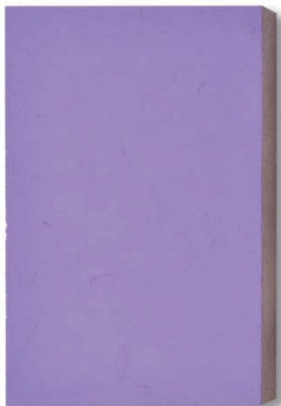
D000ß lilla 45120 – 2015 Pigment auf Sandstein / Pigments on sandstone 35 x 26 x 3 cm