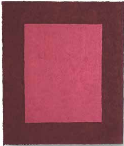
# 0408 Roter Jaspis und Zinnober – 2004 Jaspis, Zinnober, Zellulose, Holz / Jasper, cinnabar, cellulose, wood 68 x 57 x 2,8 cm