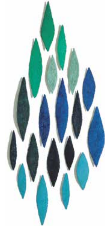
# 9005 Grüner Jaspis – 1990 Grüner Jaspis, Azurit, Chrysokoll, Vivianit, Lapislazuli, Malachit, Verdit, Zellulose, 19-teilig / Green jasper, azurite, chrysocolla, vivianite, lapis lazuli, malachite, verdite, cellulose, 19 pieces 121 x 51 cm