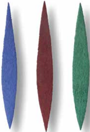
# 9422 Lapislazuli Zinnober Malachit – 1994 Lapislazuli, Malachit, Zinnober, Zellulose, 3-teilig / Lapis lazuli, malachite, cinnabar, cellulose, 3 pieces 53 x 40 cm

Helmut Dirnaichner wurde 1942 in Kolbermoor, Bayern geboren. Er lebt und arbeitet in München und Mailand.