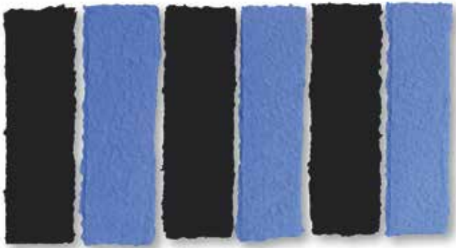
# 2030 Lapislazuli, gebranntes Elfenbein – 2000 Gebranntes Elfenbein, Lapislazuli, Zellulose, 6-teilig / Ivory black, lapis lazuli, cellulose, 6 pieces 31 x 59 cm