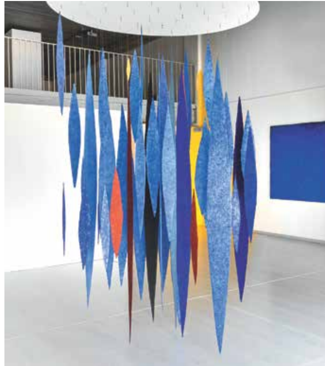
Meteore – 2008 - 2018 Lapislazuli, Vivianit, Zinnober, Jaspis, Shungit, Kobalt, Gold, Zellulose, 51-teilig / Lapis lazuli, vivianite, cinnabar, jasper, shungite, cobalt, gold, cellulose, 51 pieces 300 x ø 180 cm