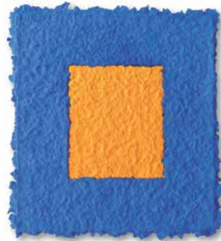
# 1222 Oltre il blu – 2012 Lapislazuli, Auripigment, Zellulose auf Holz / Lapis lazuli, auripigment, cellulose on wood 39 x 35,5 cm

Dirnaichner arbeitet seit 1982 mit Steinen und Halbedelsteinen wie Azurit, Malachit und Lapislazuli, welche zum Ursprung der Malerei zurückführen. Die Steine entdeckt er als natürliche Farbpalette. Zu Beginn des Schaffungsprozesses zerstößt, mörstert und zerreibt er sie bis ein Granulat entsteht. Diese Mineralsubstanz wird ohne Bindemittel in Zellulose hineingeschöpft. Sie durchdringt den so