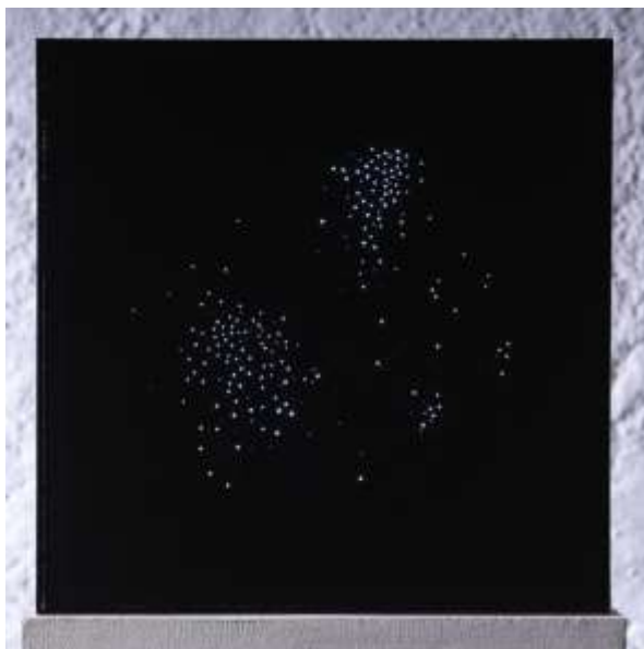
Kleines Tozeur Objekt, 2002, Siebdruck auf Acrylglas, Leuchtstoffröhre, E-Motor (0,5 U/min), Auflage 6 Ex. 40 x 40 x 10 cm