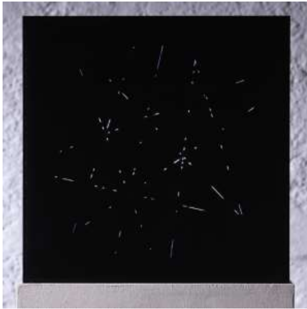
Kleines Nefta Objekt, 2020, Siebdruck auf Acrylglas, Leuchtstoffröhre, E-Motor (0,5 U/min), Auflage 4 Ex. 40 x 40 x 10 cm