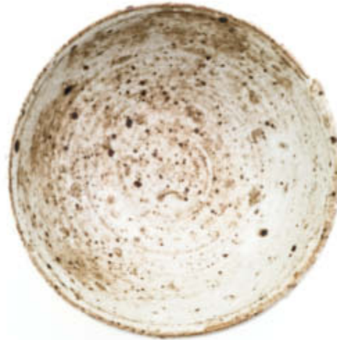
Motiv 4 – 2015 Fine Art Print 2018 49 x 49 cm (siehe Detail Titel / view detail on cover)