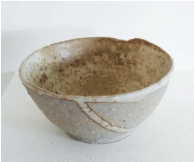
Schüsselchen – 2001 ff. Steinzeug, Gesteinsmehl-Ascheglasur / Stoneware, ash glaze Höhe 5,6 cm, Durchmesser 9,1 cm