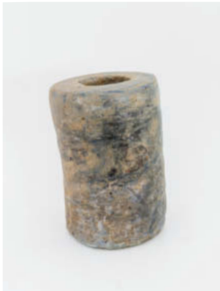
Zylinder – 1992 ff. Steinzeug, rote Erde, Porzellan-Engobe, Kobalt / Stoneware, red earth, porcelaine-engobe, cobalt 13,5 cm x 10 cm