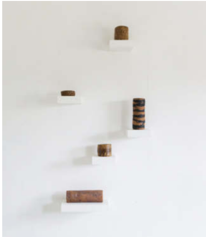
Zylinder, Steinzeug, verschiedene Größen / Cylinder, stoneware, various sizes

Galerie Renate Bender Türkenstraße 11 D-80333 München Telefon: +49-89-307 28 107 Telefax: +49-89-307 28 109 E-Mail: galeriebender@gmx.de www.galerie-bender.de