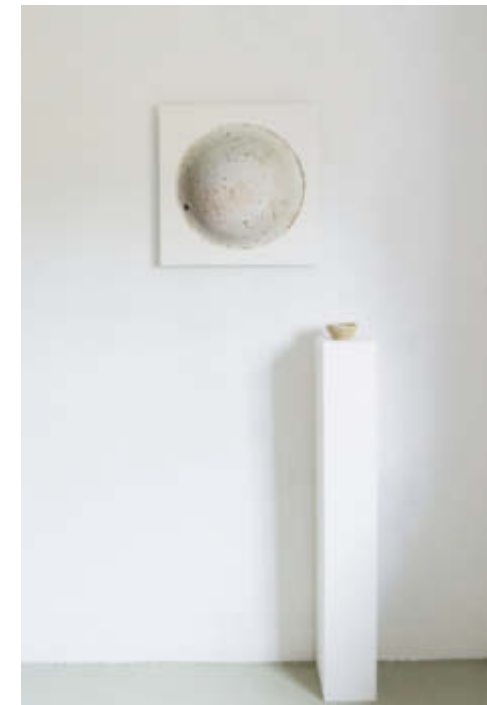
Installationsansicht / Installation view