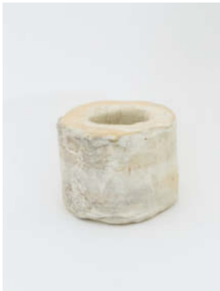
Zylinder – 2016 Steinzeug, Porzellan-Engobe / Stoneware, porcelaine-engobe 9,5 cm x 8 cm