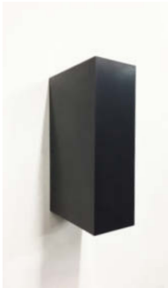
Double Golden Mean – 2015 Gepresster Graphitstaub, gebrannt und poliert / Solid graphite, burned and polished, 33 x 12,7 x 21 cm