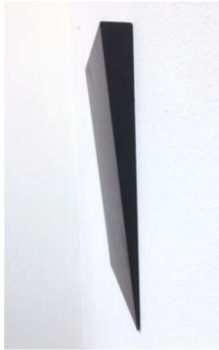
Wedge – 2016 Gepresster Graphitstaub, gebrannt und poliert / Solid graphite, burned and polished, 19 x 12,5 x 2 cm