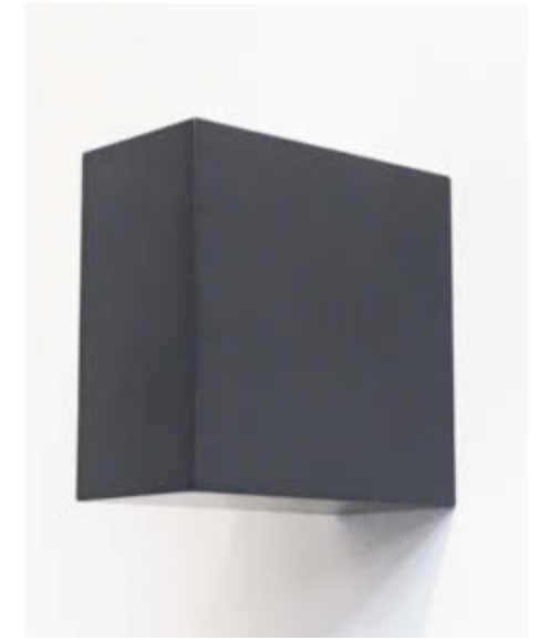
Projecting square – 2016 Gepresster Graphitstaub, gebrannt und poliert / Solid graphite, burned and polished, 20,3 x 10,2 x 20,3 cm