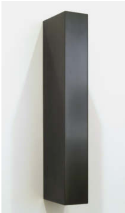
Asymmetrical Vertical Bar – 2007 Gepresster Graphitstaub, gebrannt und poliert / Solid graphite, burned and polished, 52,7 x 7,6 x 13,6 cm