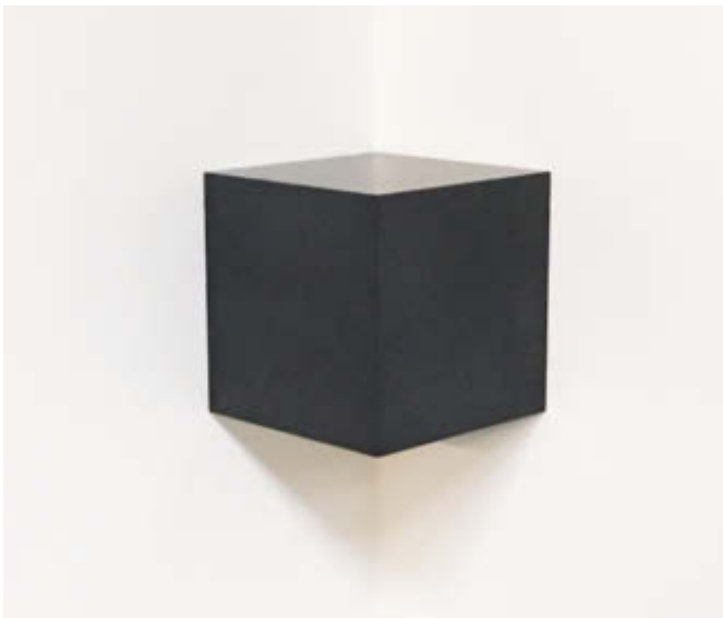
Askew Cube – 2011 Gepresster Graphitstaub, gebrannt und poliert / Solid graphite, burned and polished, 19 x 19 x 19,3 cm

Galerie Renate Bender Türkenstraße 11 D-80333 München Telefon: +49-89-307 28 107 Telefax: +49-89-307 28 109 E-Mail: galeriebender@gmx.de www.galerie-bender.de