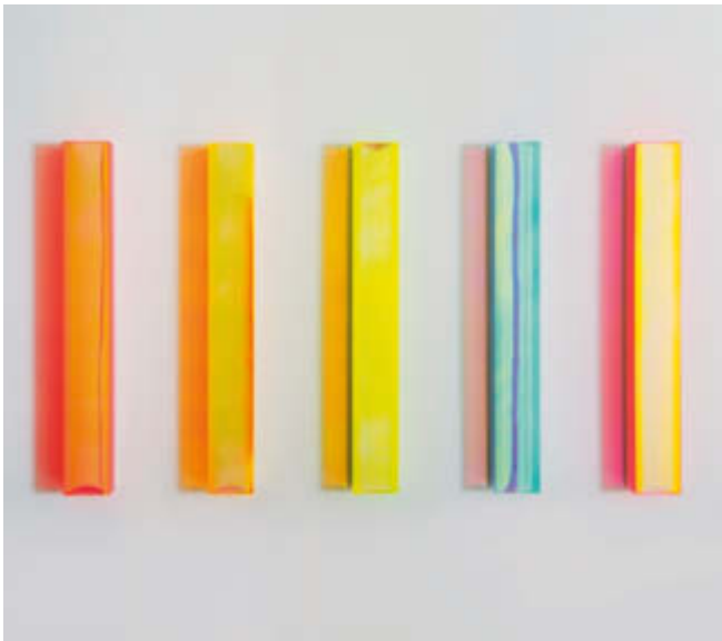
links/left: colormirror köln – new york – 2014

(siehe Detail Titel/view Detail on front page)