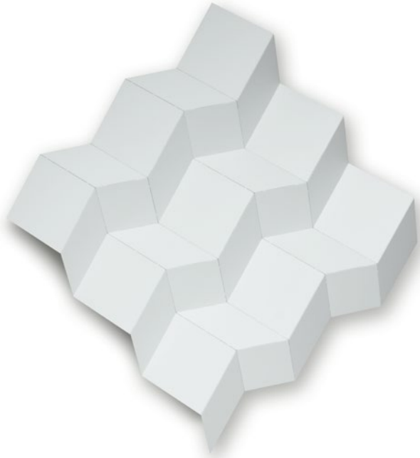
9 Quadrate, 2018, Edelstahl pulverbeschichtet, weiß, gefaltet, Auflage 3 Ex.