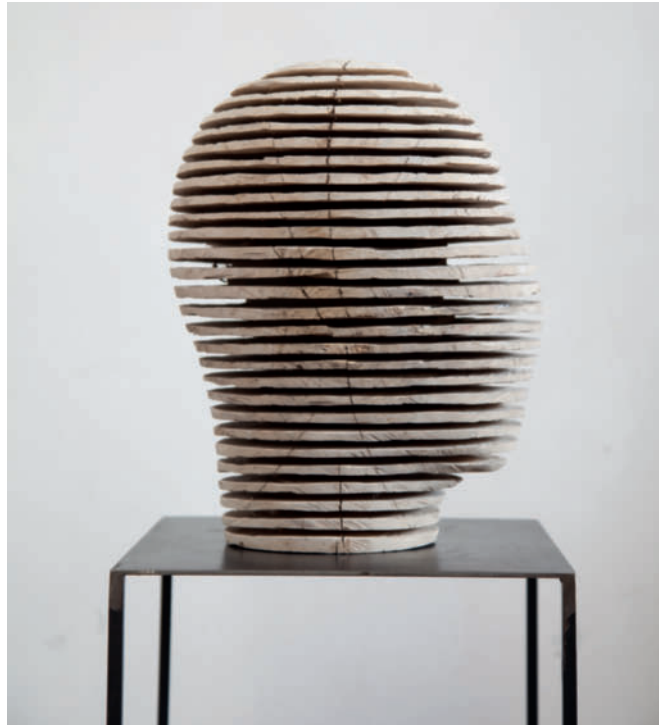
Untitled – 2013 Nussholz, Acryl 39 x 30 x 23 cm

Messebeteiligungen Herbst/Winter 2013: art miami – International Contemporary & Modern Art Fair Miami, FL, USA – 3. bis 8. Dezember 2013