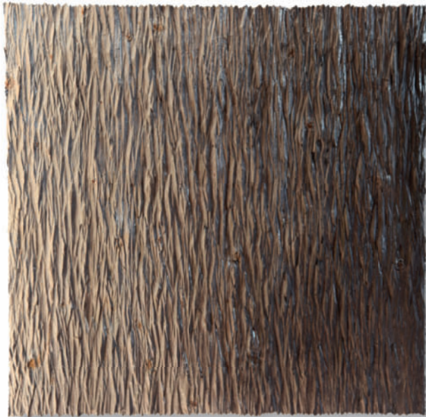
Untitled – 2013 Fichtenholz, Beize 60 x 61 cm