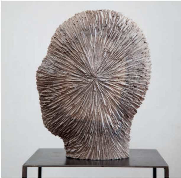
Center – 2013 Nussholz, Beize 38 x 21 x 29 cm