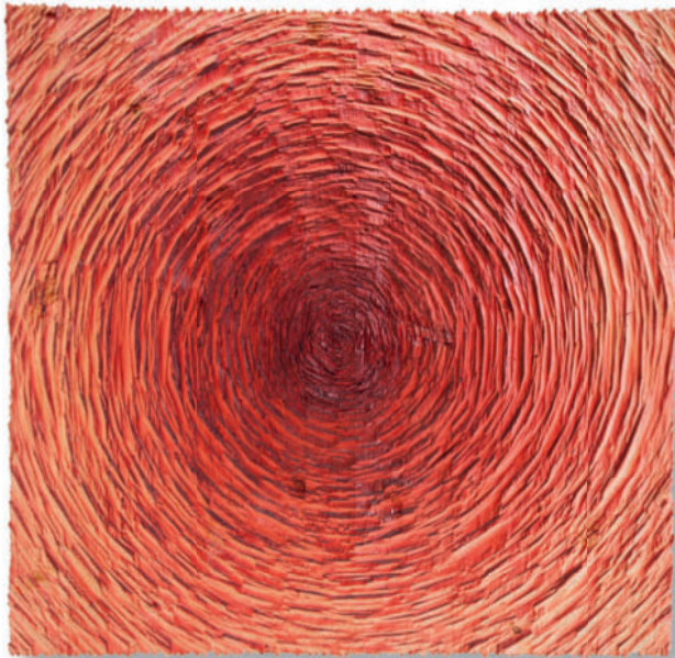
Centring – 2013 Fichtenholz, Beize 60 x 61 cm