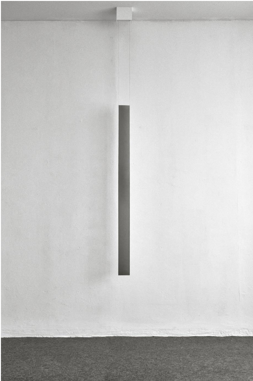
Cluster , einteilig, 2018, Draht, Aluminium, Sinustöne, Elektronik, MDF, Resonanzobjekt, 150 x 10 cm