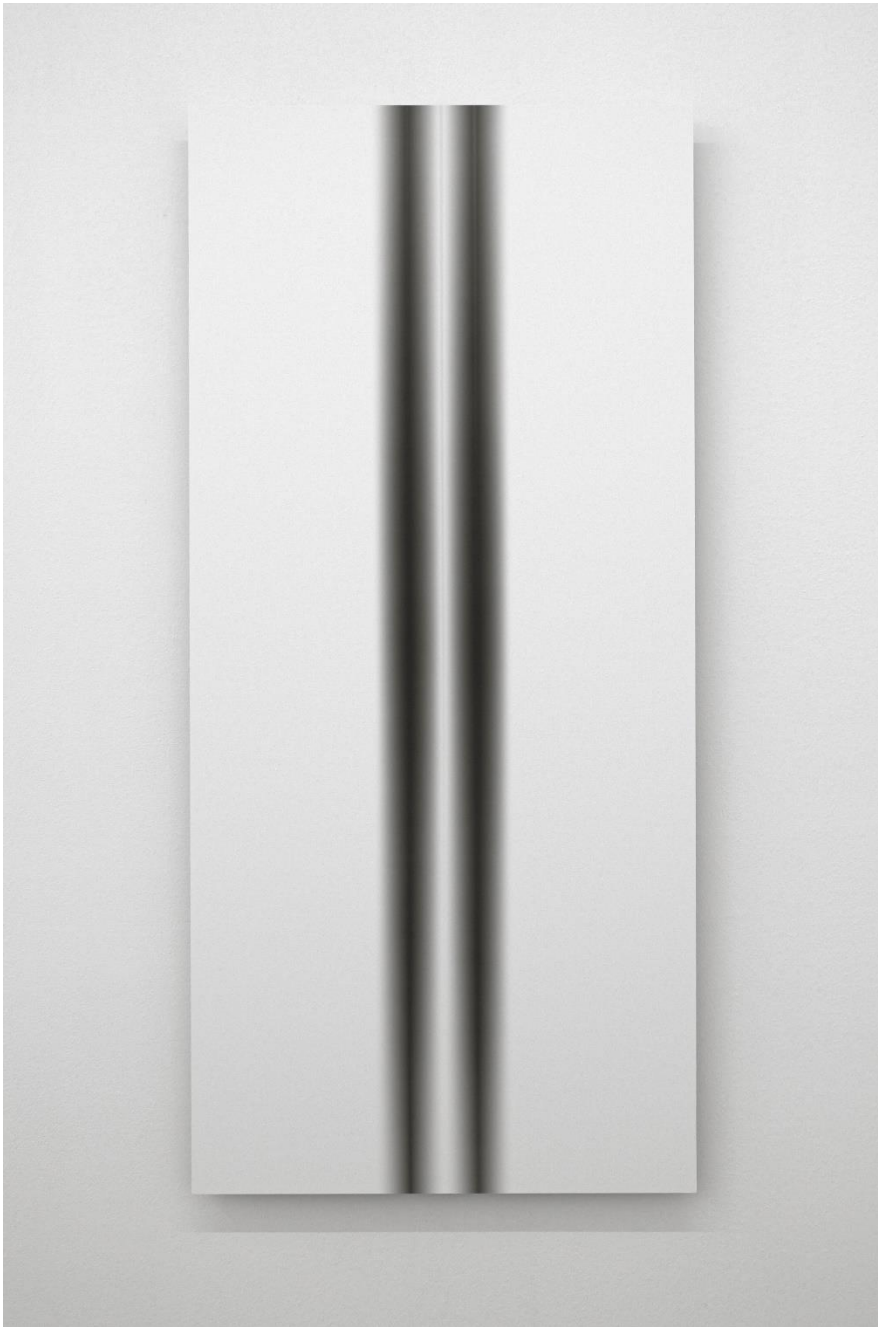
3 aus Gruppe II, 2018, Silbergelatinepapier auf Aludibond, Luminogramm, 95 x 45 cm