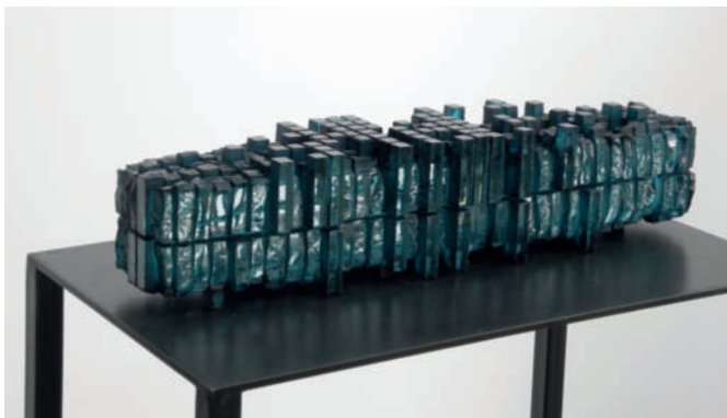
Ohne Titel – 2013 Verbundglasblock, gesägt, gemeißelt und patiniert 66,5 x 14 x 14 cm

Till Augustin was born in 1951 near Starnberg/ Bavaria, Germany. He lives and works in Nuremberg, Germany.