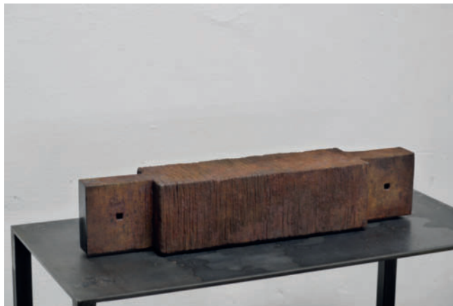
Die Verbindung – 2006, Multiple 4/11 Verbundglasblock, gesägt und Eisenoxyde ca. 61 x 12 x 12 cm

Messebeteiligungen Herbst/Winter 2013: art miami – International Contemporary & Modern Art Fair Miami, FL, USA – 3. bis 8. Dezember 2013