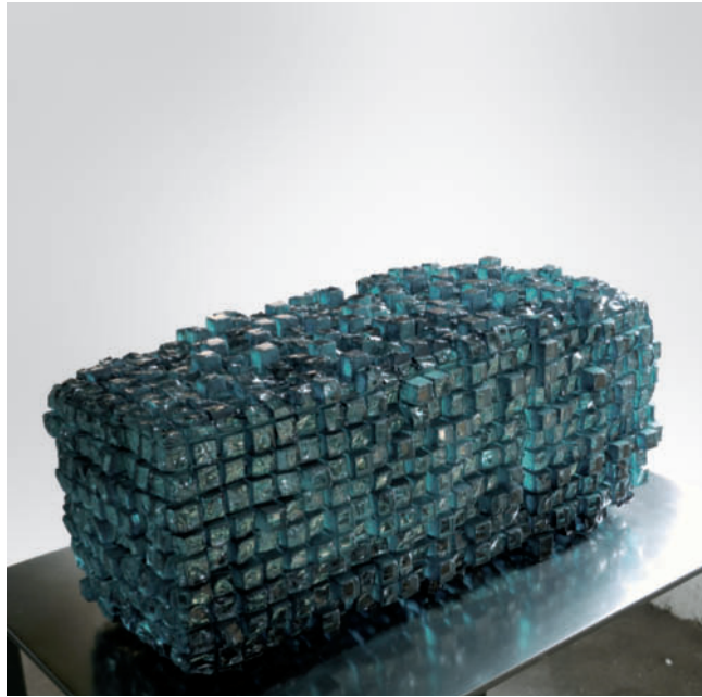
Kryptonit IV – 2012 Verbundglasblock, gesägt und gemeißelt 22 x 22 x 51 cm