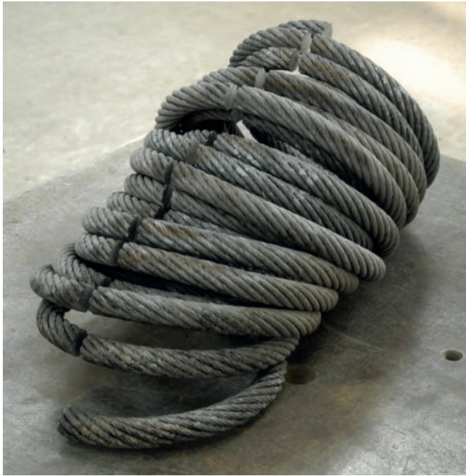
oben links: Ent-Windung – 2013 Stahlseil, feuerverzinkt, gesägt und patiniert 18 x 23 x 43 cm