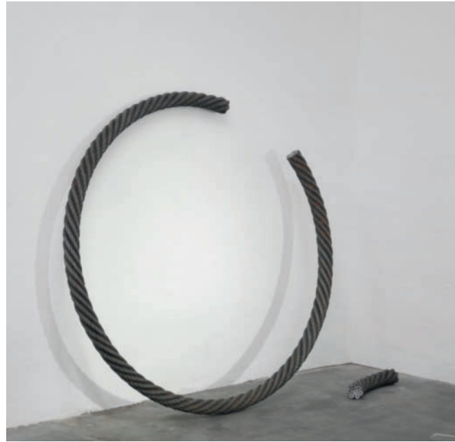
Zirkelschluss unterbrochen – 2013 Stahlseilschlinge, zersägt, feuerverzinkt und patiniert Durchmesser ca. 143 cm