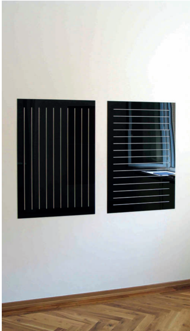
Diptych: Ten single vertical slots, fifteen single horizontal slots, parallel pattern – 2005 Cast acrylic sheet, hardened steel pins, polyester tube, each 100,8 x 72 x 0.3 cm