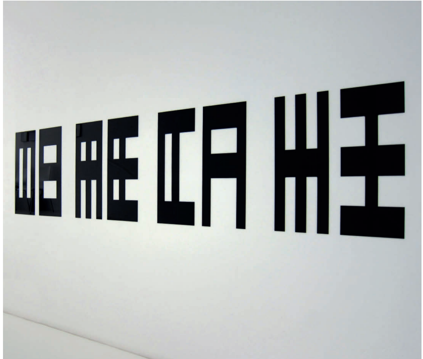
Reflective Editor, 4 Diptychs – 2011/12 Cast acrylic Sheet, hardened steel pin, polyester tube Edition of 3, each 75 x 30 x 0.3 cm

Gabriele Kübler, “Doppelwelt”, in Douglas Allsop – “Nine Reflective Editors”, exhib. cat., Stiftung für konkrete Kunst, Reutlingen, 2005.