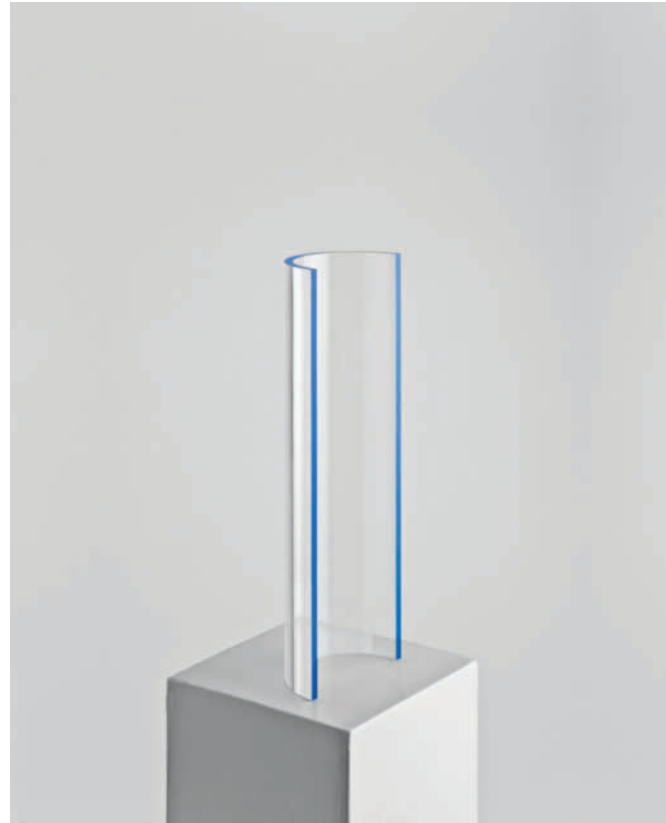
„offener zylinder mit farbtransfer“ – 2011 Acrylglas farblos, einseitig mit blauer Folie – 39 x 13 x 6,5 cm – Multiple 3 Ex.

„Mit dem Einfachsten Wesentliches ausdrücken“ gehört zum Kanon des künstlerischen Schaffens von Hellmut Bruch.