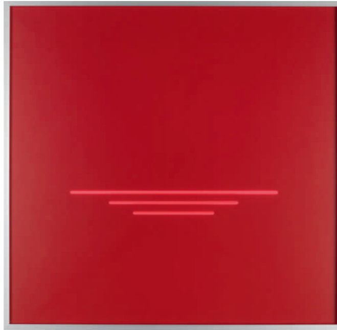
„axiale progression“ – 2012 – Acrylglas fluoreszierend – 50 x 50 x 0,3 cm

Messebeteiligungen Frühjahr/Sommer 2013: