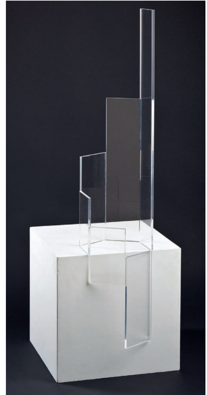
„hexagonale progression“ – 2010 Acrylglas farblos – 123 x 29 x 24,5 cm

“Expressing the essential using the simplest means” is an axiom in the repertoire of Hellmut Bruch’s artistic work.