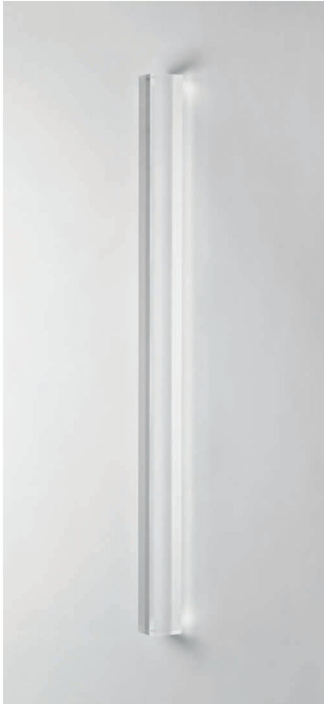
„vertikale“ – 2010 – Acrylglas farblos – 144 x 5 x 5 cm