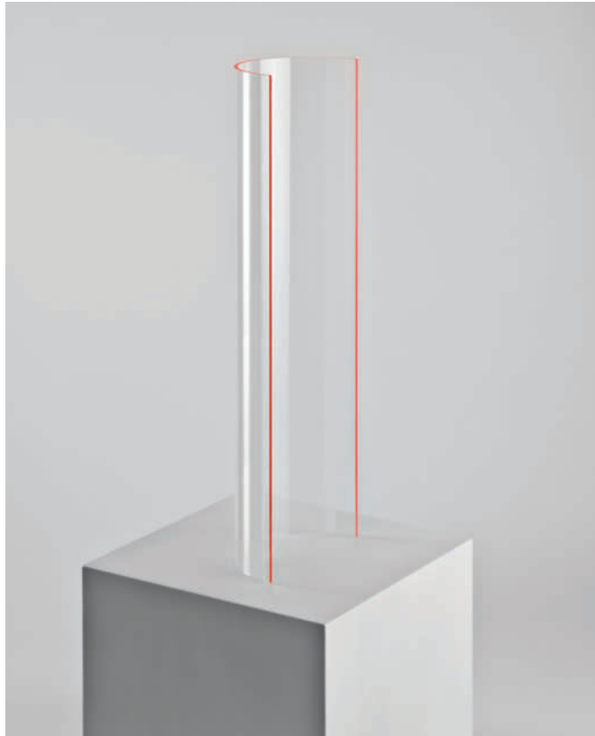
„offener zylinder mit farbtransfer“ – 2011 Acrylglas farblos, einseitig mit roter Folie – 89 x 27 x 15 cm