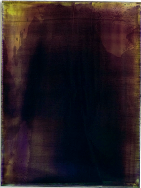
201111111 – 2011 Acryl auf Leinwand – 120 x 90 cm – 47 1/4 x 35 3/4 inches