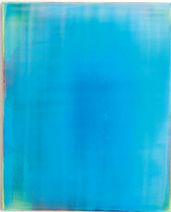
20110907 – 2011 Acryl auf Leinwand – 160 x 130 cm – 63 x 51 1/4 inches

Galerie Renate Bender Maximilianstrasse 22/II D-80539 München Telefon: +49-89-307 28 107 Telefax: +49-89-307 28 109 E-Mail: galeriebender@gmx.de www.galerie-bender.de