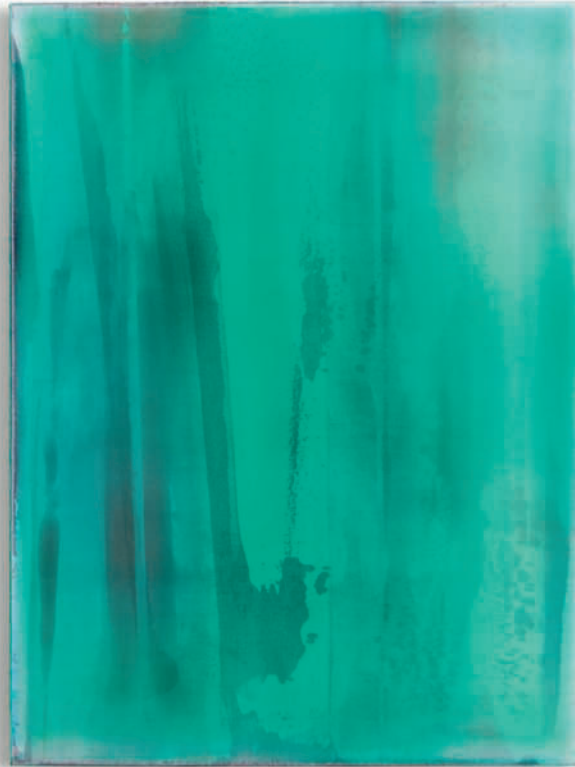
20111107 – 2011 Acryl auf Leinwand – 120 x 90 cm – 47 1/4 x 35 3/4 inches