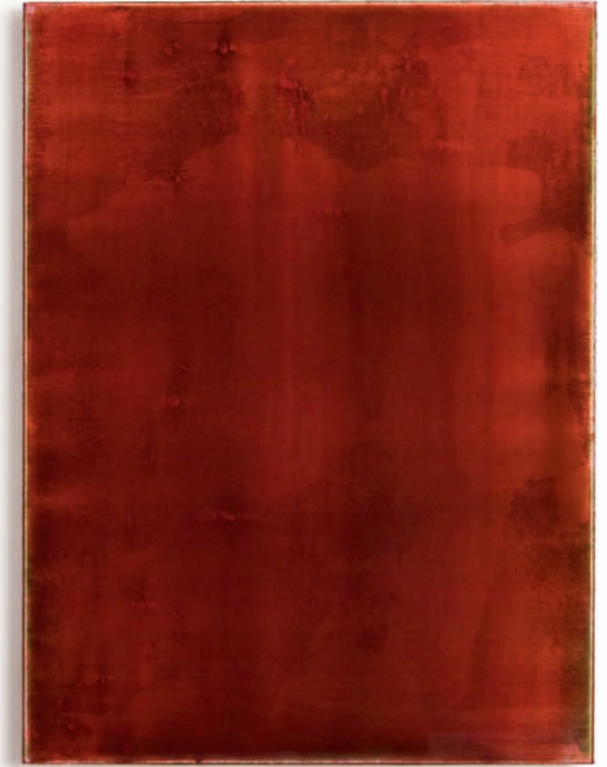
20111201 – 2011 Acryl auf Leinwand – 120 x 90 cm – 47 1/4 x 35 3/4 inches