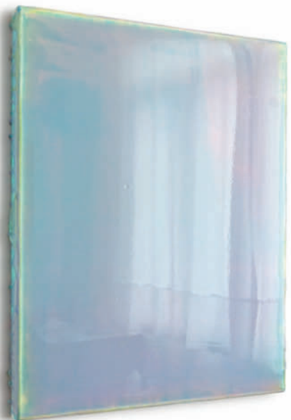
20060511 – 2006 Acryl auf Leinwand – 50 x 40 cm – 19 2/3 x 15 3/4 inches