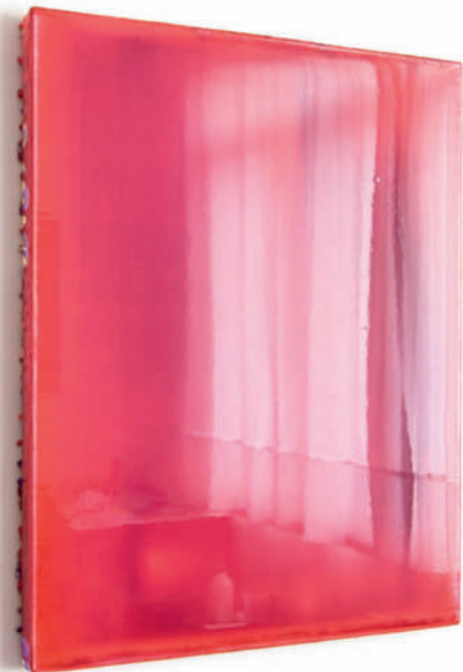
20061003 – 2006 Acryl auf Leinwand – 50 x 40 cm – 19 2/3 x 15 3/4 inches