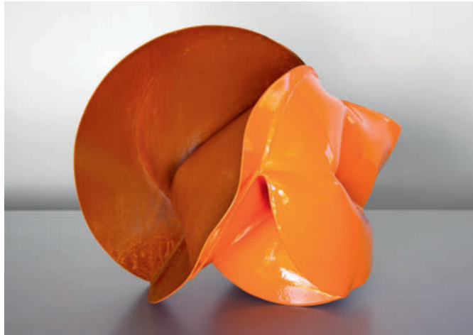
A:C Orange – 2013 geschmiedeter Stahl, pulverbeschichtet / forged mild steel and powder coat 36,2 x 43,3 x 42,5 cm (siehe Detail Titelbild / View detail on title)