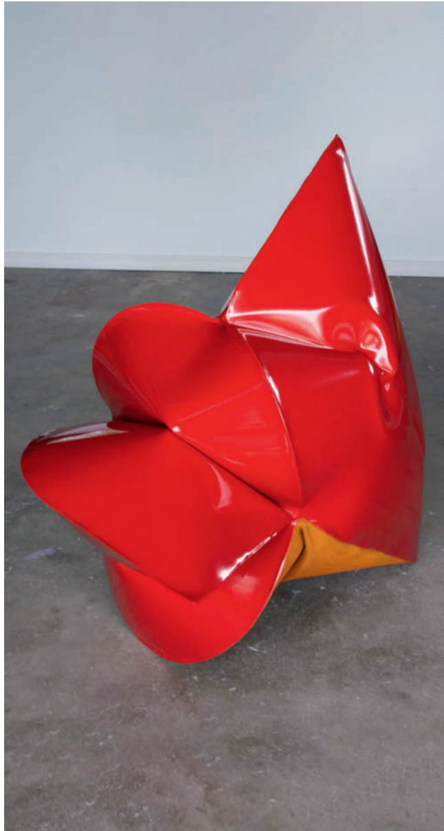
Mini Tractor Red – 2012 geschmiedeter Stahl, pulverbeschichtet / forged mild steel and powder coat 85,7 x 95,3 x 58,4 cm