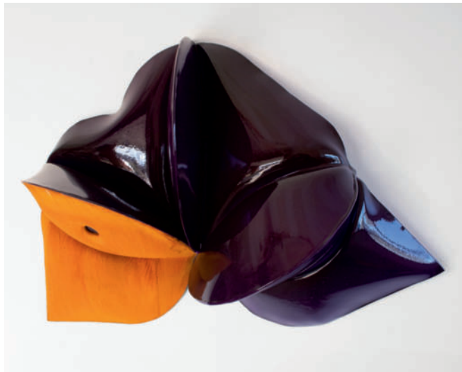
Black Beauty – 2014 geschmiedeter Stahl, Acryl / forged mild steel and powder coat 39,4 x 62,2 x 18,4 cm