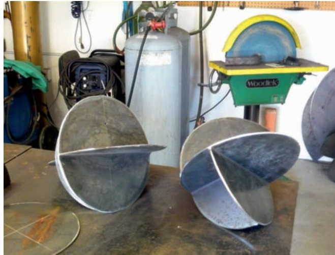
Zu geometrischen Formen geschweißte Stahlplatten vor der Behandlung mit Pressluft. Forms welded prior to inflation.