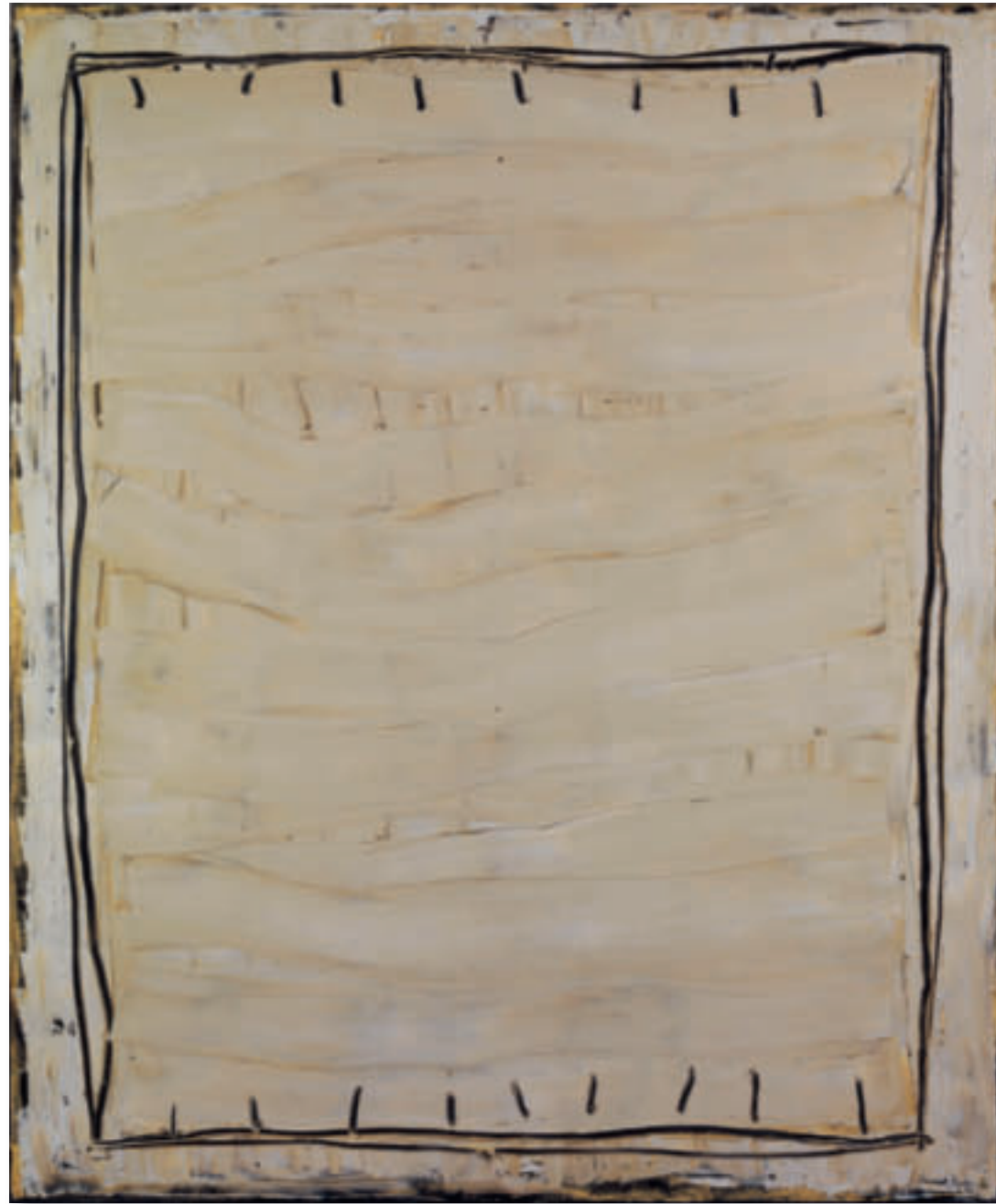
Vorderseite: Ausschnitt St-61 – 2003 Gouache auf koreanischem Papier 35x52 cm

Vernissage: 09. September 2011 – 18–21 Uhr Open Art 2011: 10./11. September 2011, 11–18 Uhr