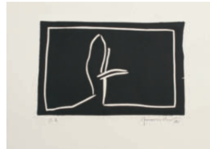
Paisatge II – 1987 Linarschnitt 29x38 cm, Edition 50