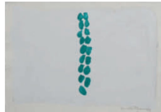
St-52 – 1998 Gouache auf Arches-Bütten 31,5x44 cm