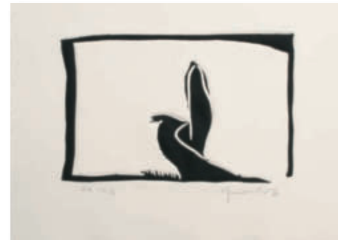
Paisatge III – 1987 Linarschnitt 29x38 cm, Edition 50