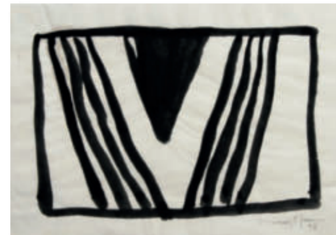
St-39 – 1998 Gouache auf Japanpapier 21,5x30 cm