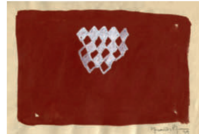
St-14 – 1999 Gouache auf Japanpapier 17,3x25 cm