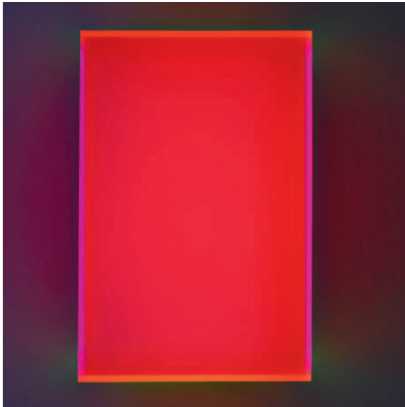
colormirror maisach red - 2012 Acrylglas fluoreszierend 75 x 50 x 15 cm, Schwarzlichtaufnahme