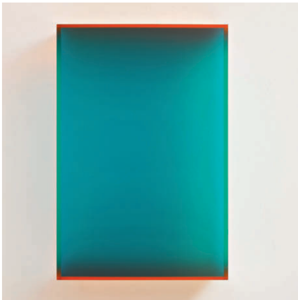
colormirror maisach blue - 2012 Acrylglas fluoreszierend 75 x 50 x 15 cm, Tageslichtaufnahme