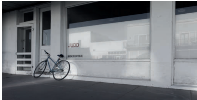
Alberto Frei, D. Judd Office, Marfa, Texas - 2011 Fotografie auf Hahnemühle-Papier 90 x 110 x 5 cm

Seit 2011 kooperiert Regine Schumann mit dem Kölner Fotografen Alberto Frei. Eine gemeinsame Installation im Sommer 2011 in Santa Fe, NM brachte die beiden nach Marfa, Texas und weiter nach Santa Fe. Die auf dieser Reise entstandenen Fotografien der texanisch/mexikanischen Landschaft von Alberto Frei und neue, für die Ausstellungsräume der Galerie konzipierte Arbeiten von Regine Schumann aus fluoreszierendem und nachleuchtendem Plexiglas sind Inhalt der Ausstellung „im fluss“.