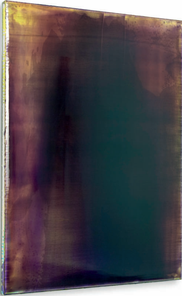
20111111 – 2011 | Acryl auf Leinwand 120 x 90 cm 47 1/4 x 35 3/4 inches