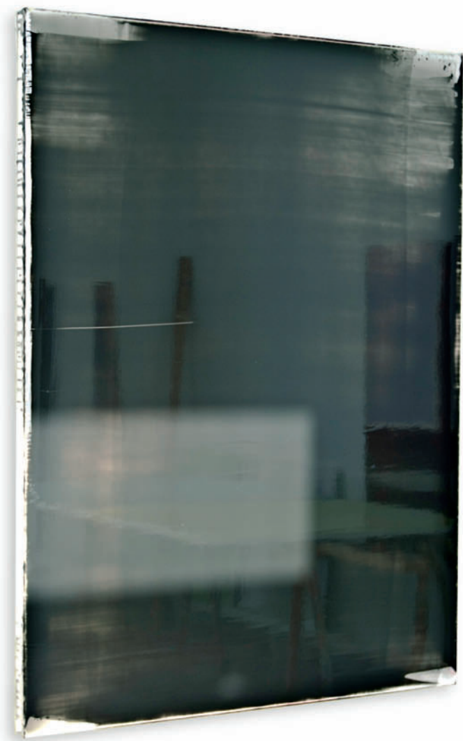
20111227 – 2011 Acryl auf Leinwand 120 x 90 cm 47 1/4 x 35 3/4 inches