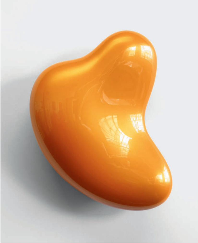
Bonzanza – 2012 Urethan auf Polyurethan-Block Urethane on Polyurethane Block 56 x 43 x 22 cm 22 x 17 x 9 2 / 3 "