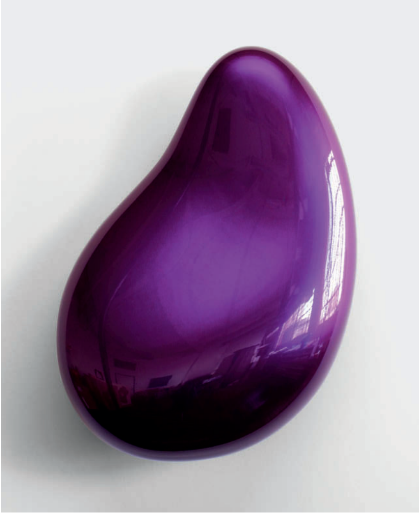
Lure – 2012 Urethan auf Polyurethan-Block Urethane on Polyurethane Block 60 x 42 x 22 cm 23 1/2 x 16 1/2 x 8 2/3"