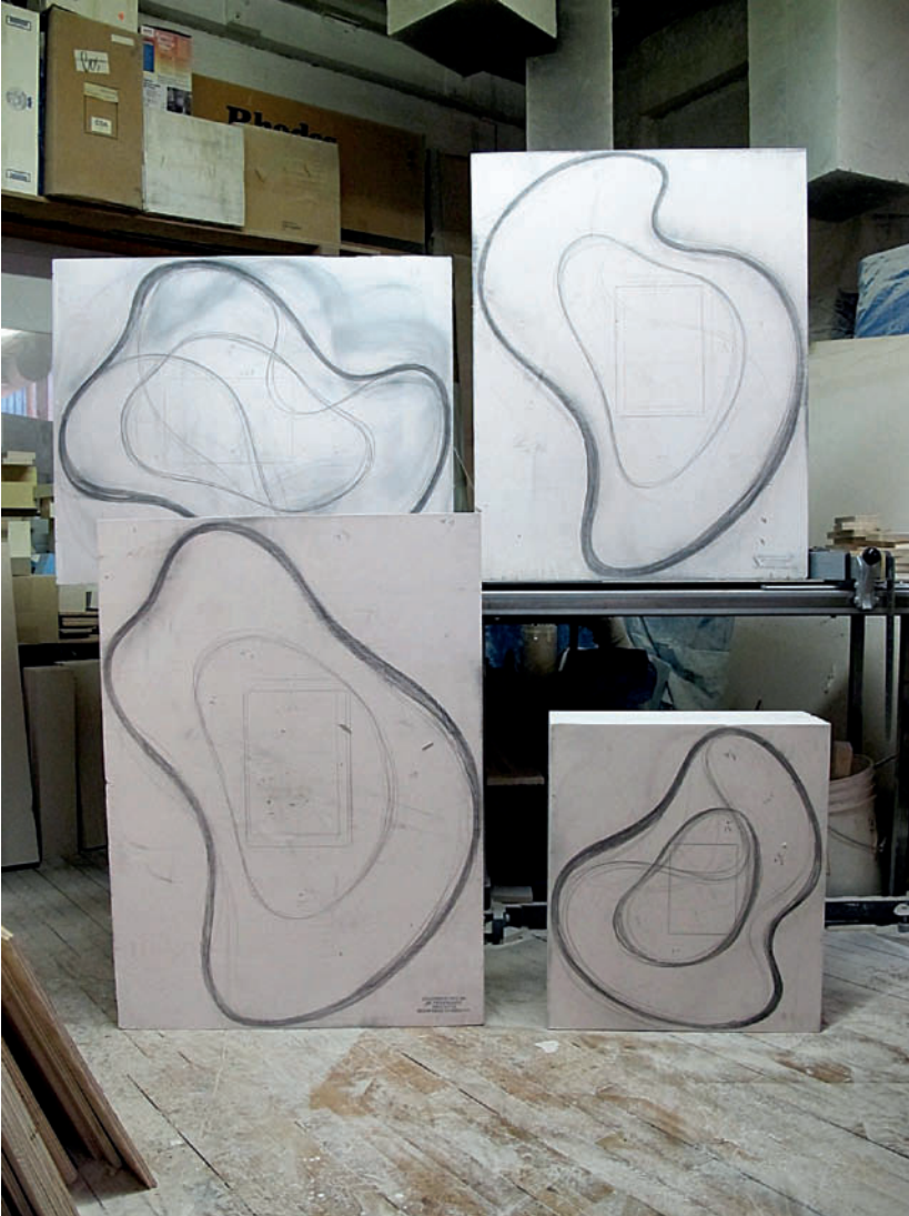
Zeichnung auf Polyurethan-Rohling | Drawing on Polyurethane block |