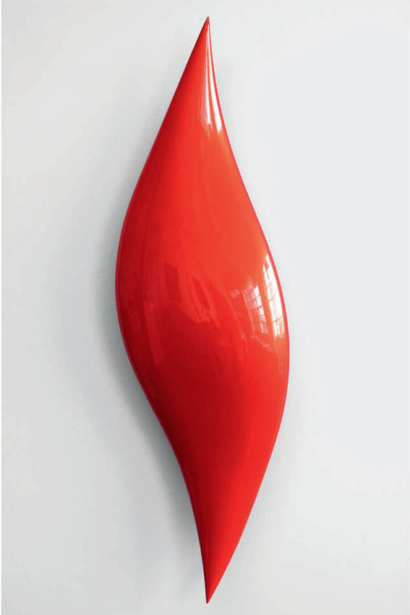
Striker – 2011 Urethan auf Polyurethan-Block Urethane on Polyurethane Block 151 x 46 x 15 cm 59 1/2 x 18 x 6"