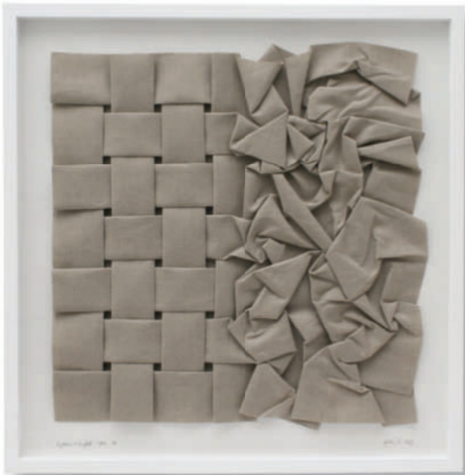
System + Zufall CAN A – 2013 – Leinwand gefaltet – 60 x 60 cm