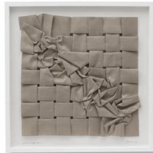
System + Zufall CAN D – 2013 – Leinwand gefaltet – 60 x 60 cm

Wir präsentieren Peter Webers Arbeiten auch international auf der ART PARIS ART FAIR (Paris, FR – 28. März bis 1. April 2013) und bei the solo project (Basel, CH – 12. bis 16. Juni 2013, mit Bill Thompson).