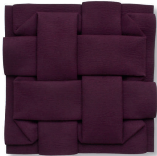
Vernetzung II FV6 – 2012 – Filz gefaltet – 47 x 47 cm