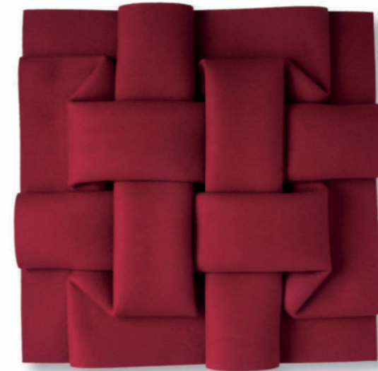
Vernetzung II FRT6 – 2008 – Filz gefaltet – 53 x 53 cm