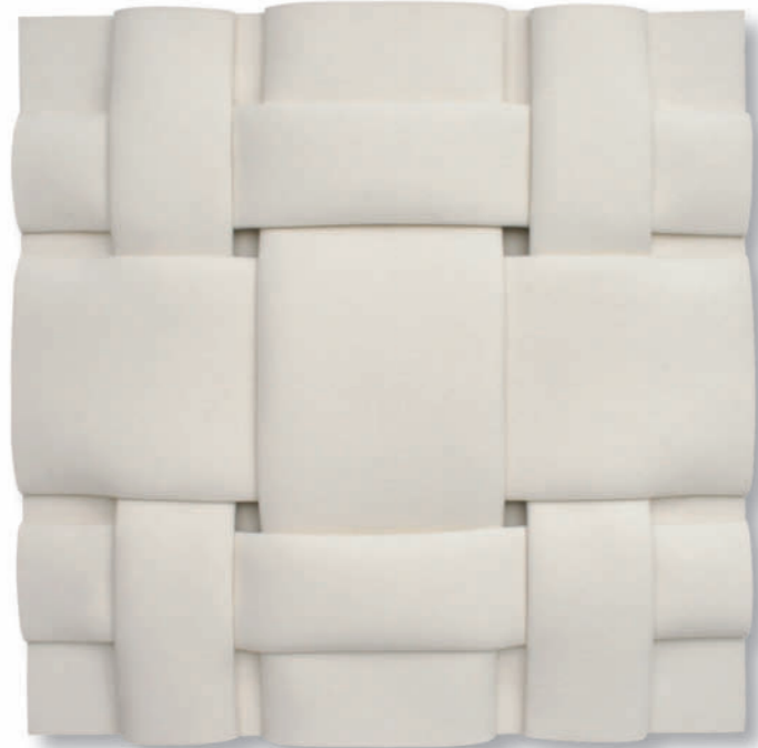
Vernetzung III FW6 - 2012 - Filz gefaltet - 92 x 92 cm