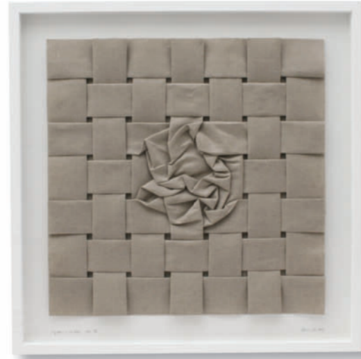
System + Zufall CAN B – 2013 – Leinwand gefaltet – 60 x 60 cm