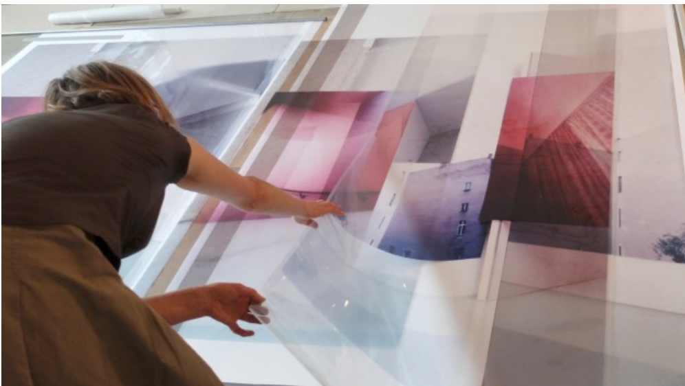
Eine Installationsansicht von Susa Templin "Sites & Constructions" (2020). (Foto: Susa Templin, VG Bildkunst Bonn 2021)

Inzwischen hat Dick auf diese Weise die vier Jahreszeiten eingefangen und mit ihren Filmstills die unterschiedliche Farbigekeit des Lichts bei Tag und Nacht festgehalten. Damit erlaubt sie Wahrnehmungen, die dem menschlichen Auge ansonsten unmöglich sind. Nachvollziehbar, dass sie mit der Arbeit "Lichtzeiten" 2019 den Kunst-am-Bau-Wettbewerb anlässlich der Erweiterung des Terminals 1 am Flughafen München gewann. Denn es ist unmöglich, sich dem Zauber dieser geometrisch-abstrakten und doch so poetisch komponierten Bilder zu entziehen. Und sie passen ausgezeichnet ins MKK, denn konkreter ist Licht kaum abzubilden.