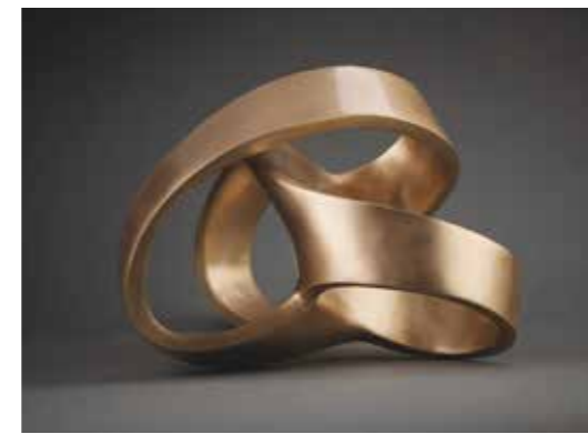
/01/ Maximilian Verhas Laokoond, Wnr. 304 / 2020 / mattierte Bronze / 33x23x24 cm