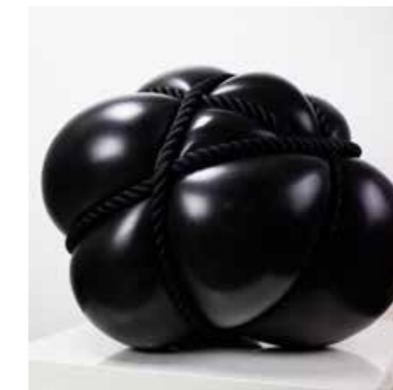
/04/ Stephan Marienfeld / Bondage / 2020 / Bronze patiniert / 70 cm / 7er Edition

Die ehemals Münchner Galerie von Braunbehrens zeigt seit ihrer Übernahme durch Frank Molliné Kunst von renommierten zeitgenössischen Künstlerinnen und Künstlern. In den Galerieräumen am Stuttgarter Feuersee finden auf rund 500 qm Fläche regelmäßig museale Wechselausstellungen mit international erfolgreichen Künstlerinnen und Künstlern statt. Über Stuttgart hinaus werden sie Sammlerinnen und Sammlern auf nationalen und internationalen Messen bekannt gemacht.