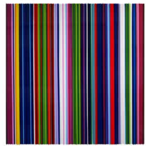
/09/ Frank Fischer / Eye of the storm II (Michael Craig Martin) / 2022 120x120cm