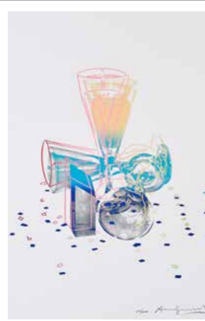
/07/ Andy Warhol Committee 2000 / 1982 / Siebdruck / 76,2 x 50,8 cm / Edition: 2000

Is ja 'n Ding! Was ein Künstler so sammelt → MUSEUM VILLA ROT 06/11/22 — 12/02/23