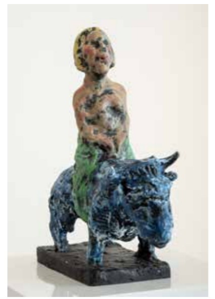
/11/ Markus Lüpertz / „Europa“ / 2022 / Bronze handbemalt / 39x36x14cm (HxLxB)