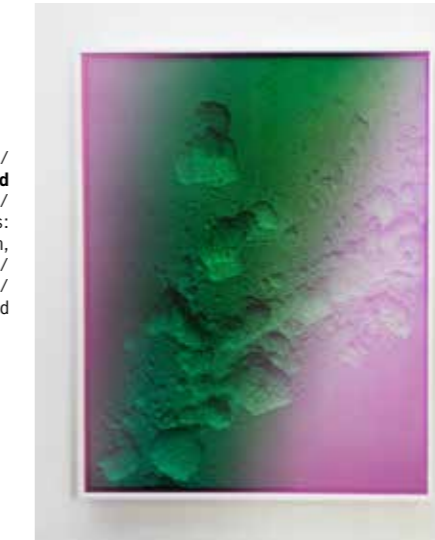
/05/ Wolfgang Flad Untitled / 2022 (green) / GE7PR, Series: Dark Side of the Moon, mixed Media / 127 x 100 cm / © Wolfgang Flad