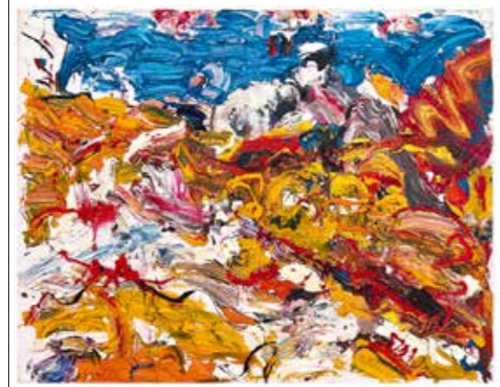
/08/ Hartwig Ebersbach Bretagne / 2019 / Öl auf Leinwand / 110x140cm