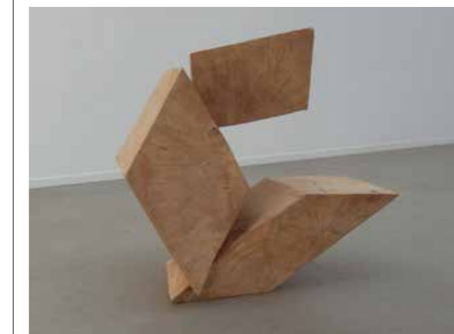
/06/ Rudolf Wachter Omaggio a Piero / 2008 / Pappel / 76 x 78 x 48 cm / © Galerie Wohlhüter

/Hoenes-Saal 04/ Galerie ART/OFF Kunstraum Dreieich Otto-Hahn-Straße 1 / 63303 Dreieich / 0171-9883330 / info@kunstraum-dreieich.de / www.kunstraum-dreieich.de / #kunstraumdreieich / #ericdecastro / #art_of_galerie