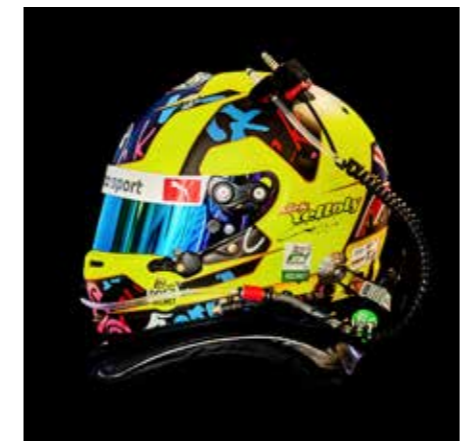
/12/ Anja Behrens Helmet 04 / 2022 / Fotografie / Ink Jet Fine Art Print auf Alu Dibond hinter Acrylglas / 40 x 40 cm / Auflage 6