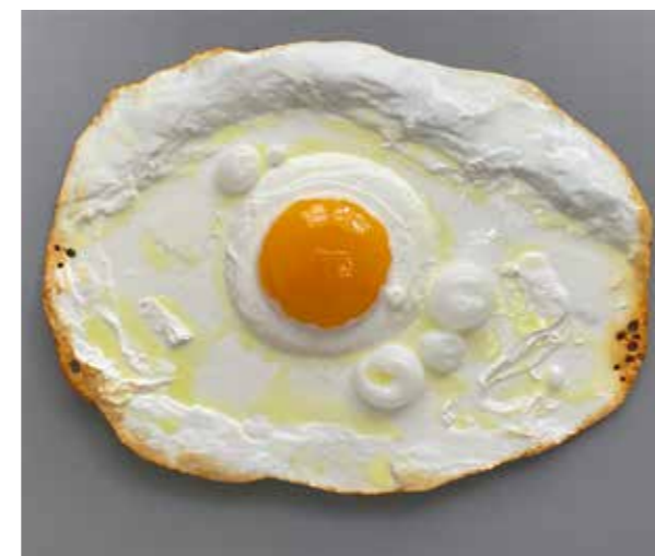
/03/ Peter Anton Fried Egg / 2022 Mixed Media / 71x94x10 cm