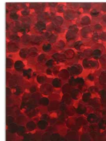
Robin Rose, „Exposure“ – 1999/2000 Encaustik auf Leinen auf Hexcel-Paneel / Encaustic on linen on Hexcel panel 61 x 45,5 cm

When Galerie Renate Bender last asked: „What's out there?“, a group exhibition with five artists from just as many countries was created on the occasion of the Open Art 2009. We dare to think outside the box again with five American artists who we represent for many years and whose work has an extraordinary physical presence. They all share an innovative approach to their respective materials: oil, polyurethane, steel, wax and graphite. The result is three-dimensional objects and relief-like surfaces in a wide range of colors. Let's take a look across the pond at new discoveries.