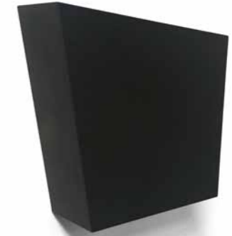
Susan York, „Drawing Center Study no.5“ – 2017, gepresster Graphitstaub, gebrannt und poliert / solid graphite, burned, polished, 15,2 x 13,3 x 4,5 cm

In recent years, Thompson has shifted away from the practice of working in series to one that approaches each new sculpture as a unique entity. He finds himself with more creative freedom, fewer design constraints. Thompson’s process begins with extensive preliminary drawings, transposed into full-scale templates and traced onto his carving blocks. He carves the large polyurethane blocks with the aid of a grinder, various sanders, and finally by hand. After the sculpting phase, up to 20 coats of automotive urethane are applied using a spray system.