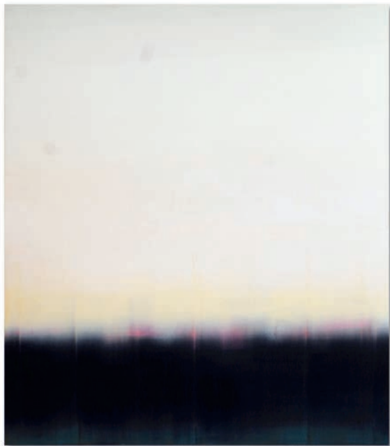
E-120.231 – 2023 Acryl, Pigmente, auf Kreidegrund, auf Gewebe, auf Holzkörper, Stahleinfassung / Acrylic, pigments, on chalk ground, on fabric, on wooden box, steel edging, 120 x 115 x 5 cm