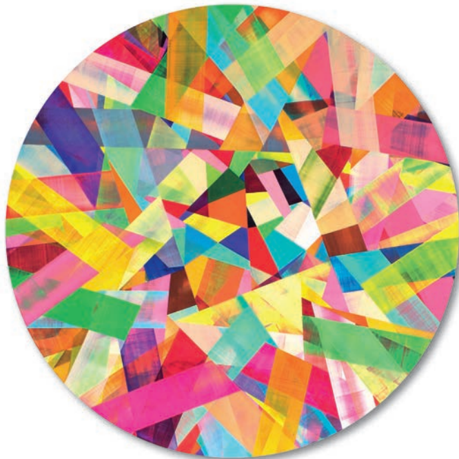
Kreis 200.231 – 2023 Acryl, Pigmente, auf Kreidegrund, auf Aludibond / Acrylic, pigments, on chalk ground, on Aludibond, Ø 200 cm, Stärke / Depth 4 mm

Galerie Renate Bender Türkenstraße 11 D-80333 München Telefon: +49-89-307 28 107 Telefax: +49-89-307 28 109 office@galerie-bender.de www.galerie-bender.de