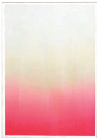
EP-30.233 – 2023 Acryl, Pigmente, auf Kreidegrund, auf Römerturm Echt Bütten, gerahmt, hinter Glas / Acrylic, pigments, on chalk ground, on handmade paper, framed, behind glass, 29,7 x 21 cm