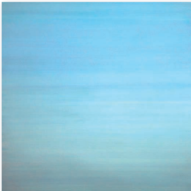
TIEFSEH II – 2003 Pigment, Lack auf Nessel auf Holz / Pigment, lacquer on nettle on wood, 120 x 120 cm (siehe Detail Titelseite / view detail on title)