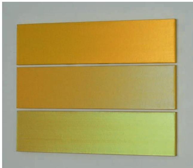
3 x GELB – 1991, Pigment, Acryl auf Nessel; dreiteilig / Pigment, acrylic on nettle; three pieces, 78 x 100 cm

Galerie Renate Bender Türkenstraße 11 D-80333 München Telefon: +49-89-307 28 107 Telefax: +49-89-307 28 109 office@galerie-bender.de www.galerie-bender.de