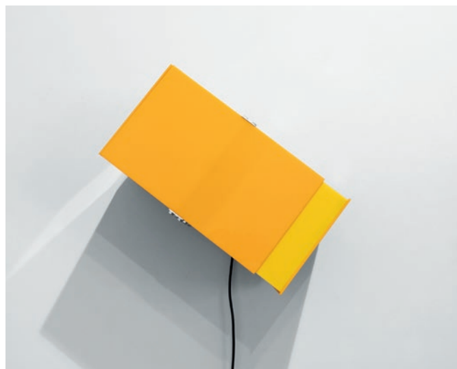
Pfeifer & Kreuzer, Walking and Falling (YELLOW) – 2020 Kinetisches Objekt, Stahl, Acrylglas, Elektromotor / Kinetic object, steel, acrylic glass, electric motor, 20,2 x 33,3 x 20,2 cm