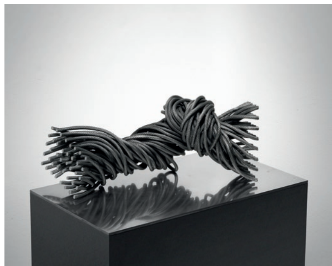
Till Augustin, Entschlüsselung – 2024 Stahlseile, gegläht, feuerverzinkt, gesägt, geschliffen und patiniert / Steel ropes, annealed, hot-dip galvanized, sawn, ground and weathered, 61 x 30 x 24 cm