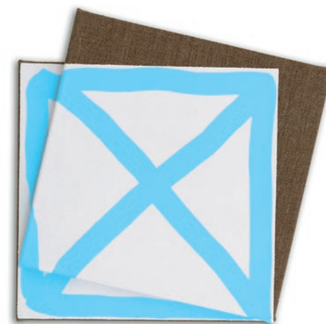
Marco Stanke – Teil aus Kollektiv – 2025 Acryl, Leinen, Keilrahmen / Acrylic, linen, stretcher frame, 36 x 36 x 5 cm