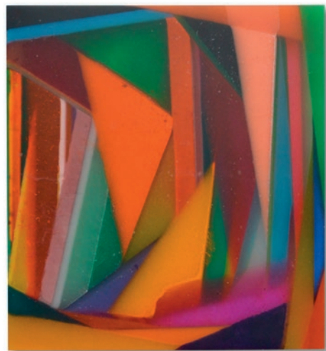
Harald Pompl, CF 010 – 2025 Harz, Pigmente, 30 x 30 x 3 cm