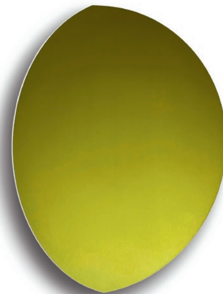
Heiner Thiel, Ohne Titel (WVZ 01/25/787) – 2025 Aluminium, eloxiert, / aluminum, anodized, 50 x 60 x 12 cm