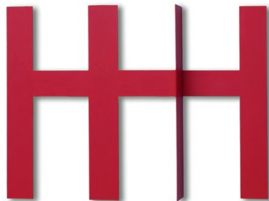
Horst Linn, „Vor-sicht“ – 1998 Stahl, Acryl / Steel, acrylic, 24 x 28 x 3,5 cm