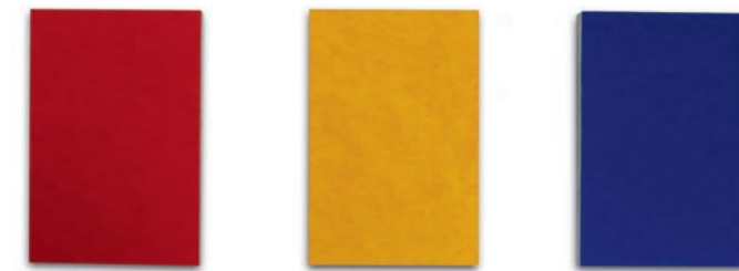
Alfonso Fratteggiani Bianchi, Ohne Titel (Triptychon) / Untitled (Triptych) – 2024 (α 0033, α 0034, α 0035) Pigment auf Sandstein / Pigment on sandstone, je / each 21 x 14 cm