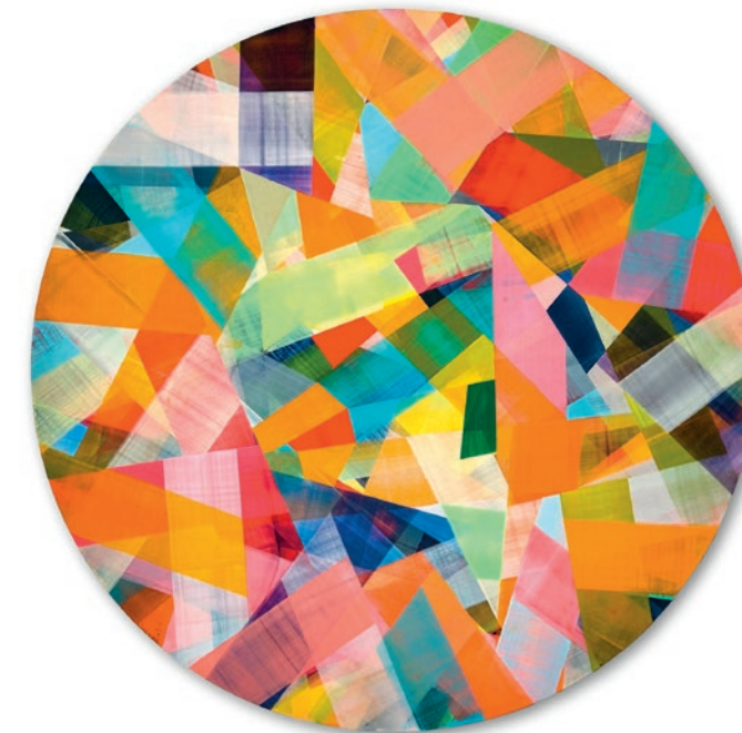
Bim Koehler, Kreis 120.02 – 2026 Pigmente, Acryl, auf Kreidegrund, auf Aludibond, Ø 120 cm