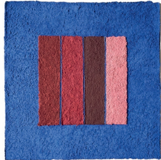
Helmut Dirnaichner, # 2025-07 Lapislazuli Thulit – 2025 Lapislazuli, Zinnober aus Almadén, Zinnober, Hämatit, Thulit, Zellulose / Lapis lazuli, cinnabar from Almadén, cinnabar, hematite, thulite, cellulose, 36,5 x 36,5 cm, im Rahmen / framed 52 x 52 cm