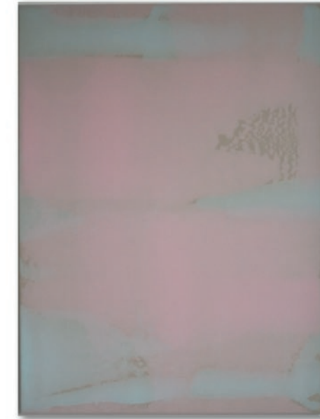
Jus Juchtmans, 20201003 – 2020, Acryl auf Leinwand / Acrylic on canvas, 120 x 90 cm