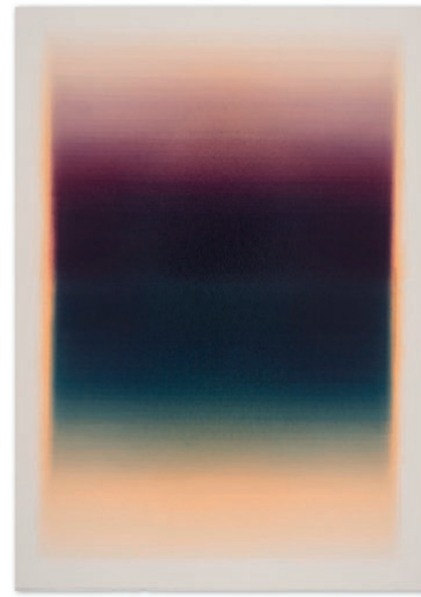
Edda Jachens, SCHICHTUNGEN 100425 – 2025 Aquarell auf Büttenpapier, im Objektrahmen mit Mirogard-Glas / Watercolor on handmade paper, in object frame with Mirogard glass, 96,5 x 68 cm