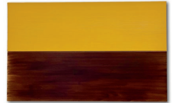
Maria Lalić, Italian Lemon Ochre Landscape Painting – 2024 (The Temple of Hera at Paestum. Fabris. c1770) Öl auf Leinwand / Oil on canvas, 56,6 x 90,5 cm