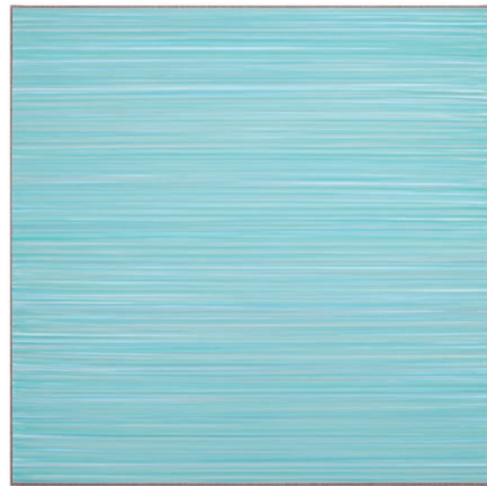
Lars Strandh, Untitled 2209 – 2022 Acryl auf Leinwand / Acrylic on canvas, 50 x 50 cm